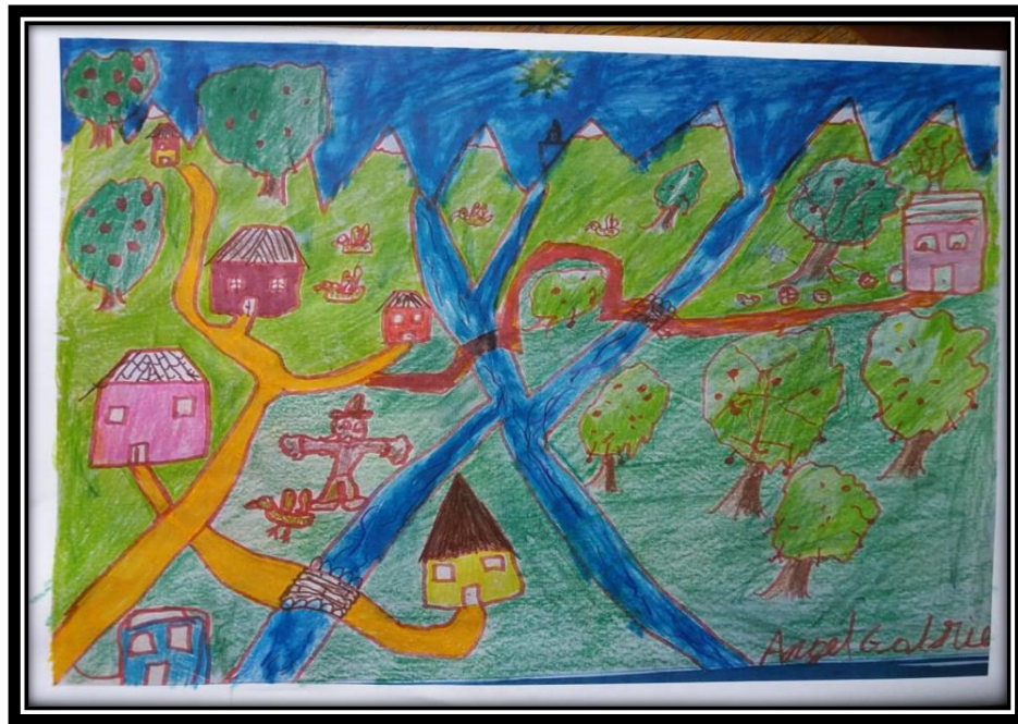
Trabajo artístico de uno de los estudiantes de la muestra.