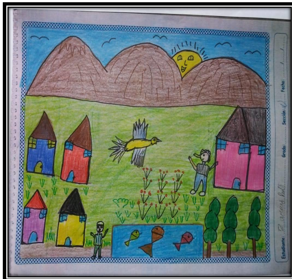
Trabajo artístico con caracteres de su comunidad del estudiante.