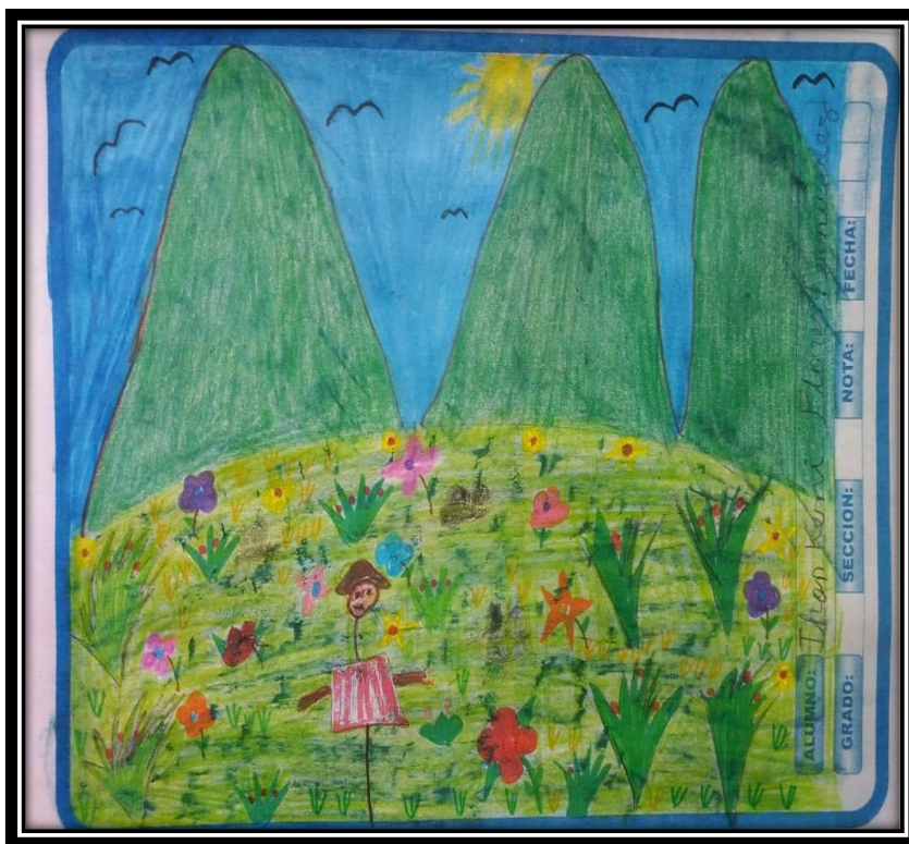
Trabajo artístico después de las sesiones de aprendizaje