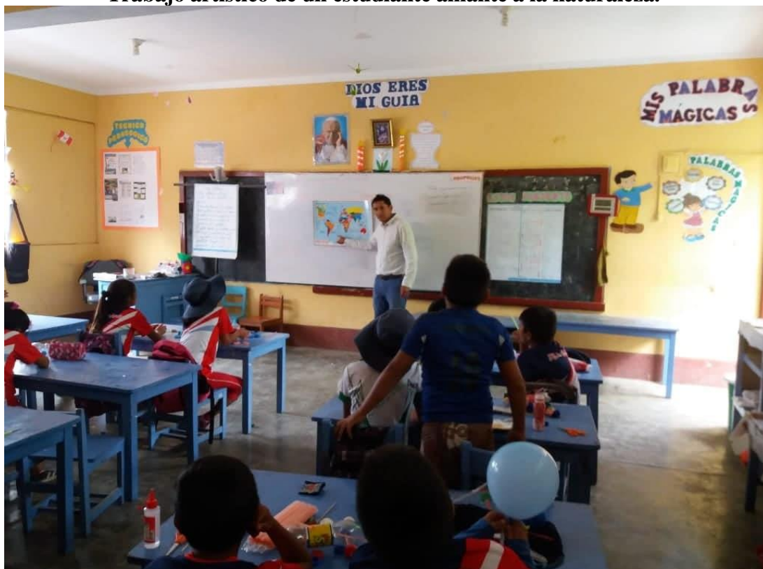
El investigador explicando los elementos compositivos de una obra artística.