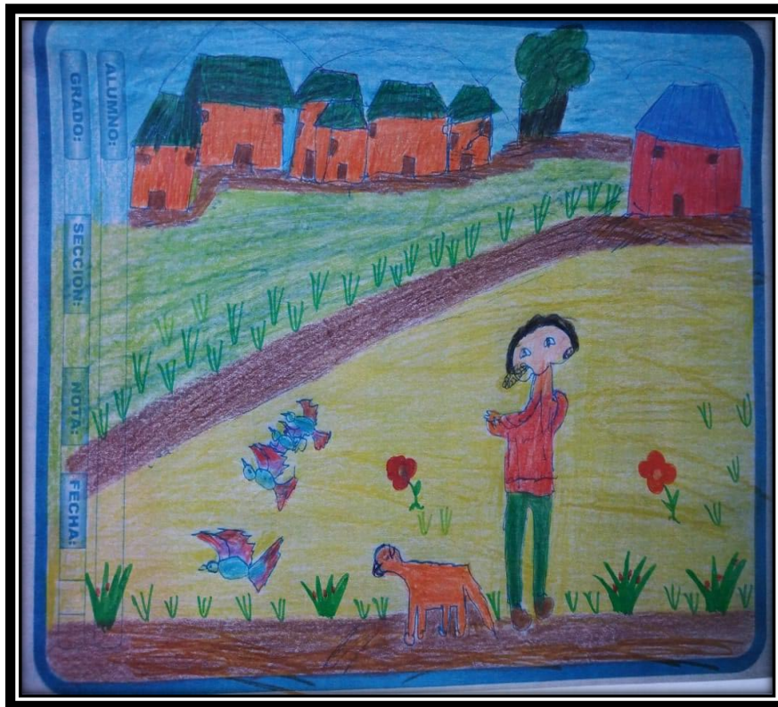
Trabajo artístico de un estudiante amante a la naturaleza.