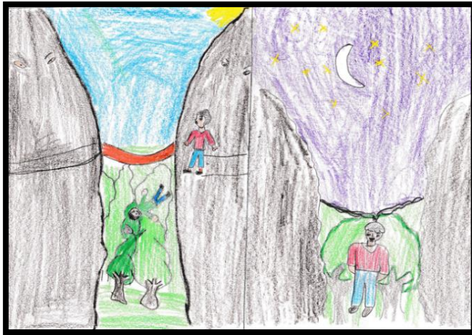
IMAGEN N° 10: Tema: "Ayahuanco"