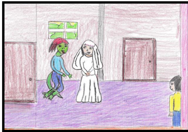
IMAGEN N° 11: Tema: "El lagarto"