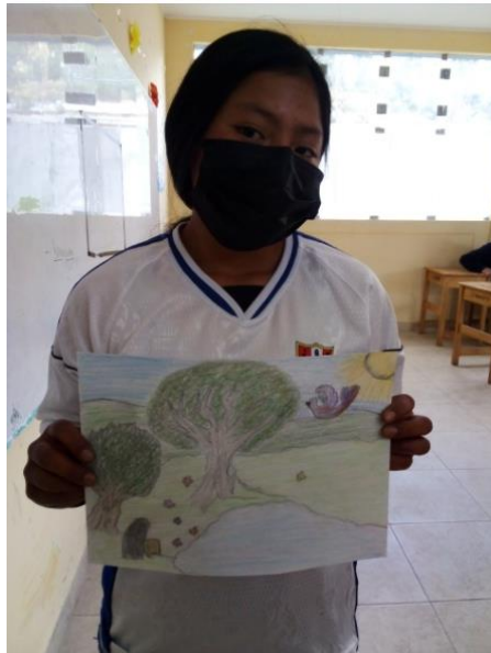
IMAGEN N° 17: Estudiante muestra su trabajo artístico