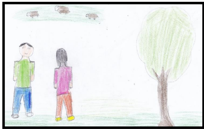
IMAGEN N° 1: Amante de la serpiente

En el análisis cualitativo de la Imagen 1. En el pre prueba, los trabajos artísticos de los estudiantes, no refieren un mensaje definido, a pesar de que, dichos trabajos se realizaron utilizando como estrategia motivacional el cuento andino “La amante de la serpiente” de