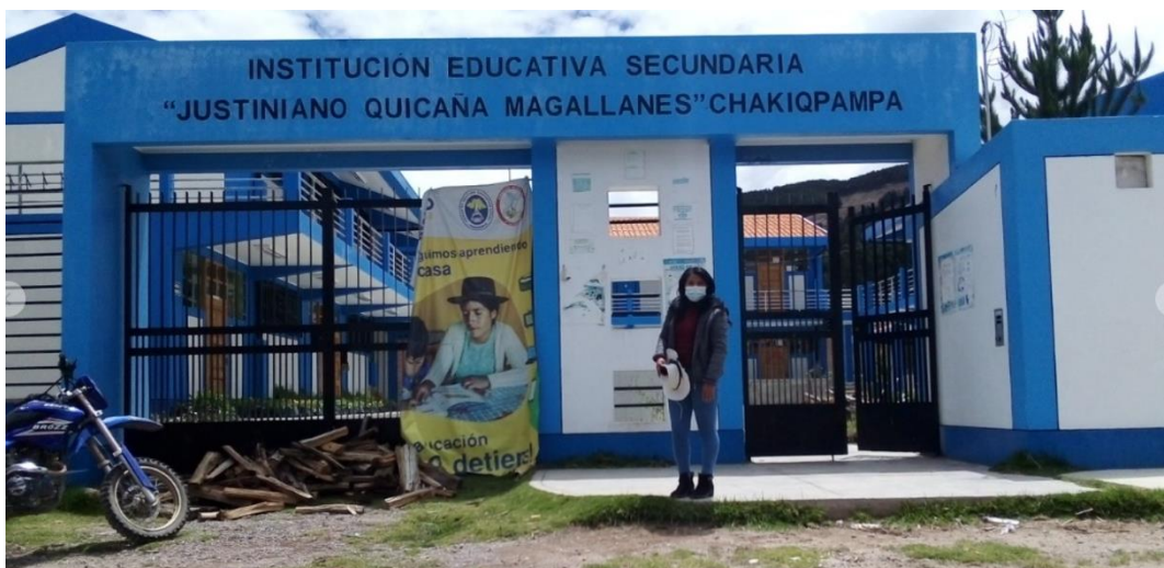
IMAGEN N° 18: Después de realizar las clases presenciales