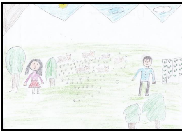
IMAGEN N° 5: Amante de la serpiente 3

Al analizar cualitativamente, el color en las expresiones artísticas de los