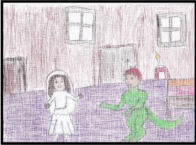
IMAGEN N° 2: El lagarto

En el análisis cualitativo de los trabajos artísticos (Imagen N° 2), de la post prueba, presentados por los educandos, se observa claramente, que la mayoría de ellos logran realizar trabajos artísticos con mayor acabado. En el análisis del dibujo artístico, se nota específicamente que los elementos empleados en la composición artística refieren sobre