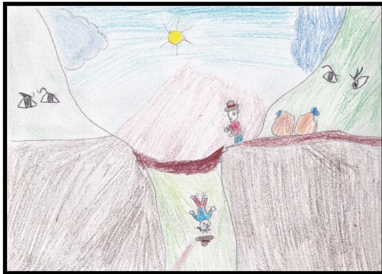
IMAGEN N° 4: Ayahuanco

referencia al cuento andino “Ayahuanco”, prevalece la forma de un personaje que va cayendo al precipicio. Las formas utilizadas son reconocibles, hay relación entre formas y espacios plasmados, además de estar