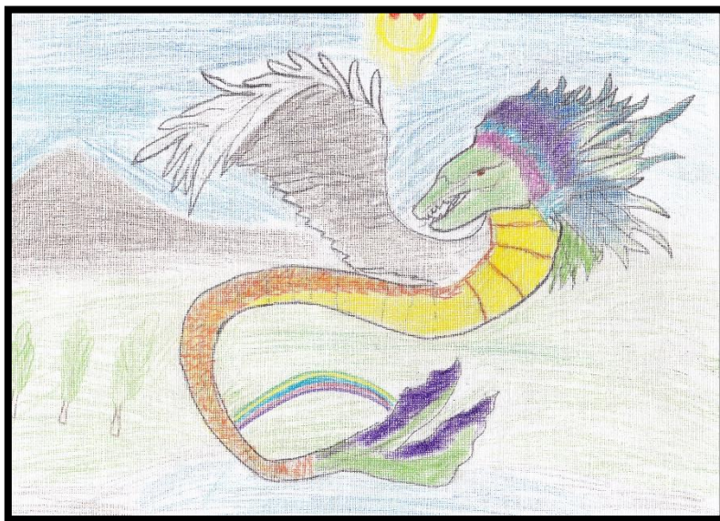
IMAGEN N° 6: El amaru

En el análisis cualitativo de la dimensión, color, en la post prueba (Imagen N° 7), los estudiantes investigados presentaron sus trabajos artísticos, interpretación del cuento andino “El amaru” de José María Arguedas, con mayor conocimiento y estudio del dibujo y el color, para ello, primero tuvieron que comprender el contenido del cuento andino contado. En la prueba de salida, la mayoría de los trabajos artísticos presentados por los educandos muestran una composición armónica cromática adecuada, hay uso de leyes en la combinación de colores, muestran interacción cromática, existiendo unidad y variedad en el uso de colores, los tonos de colores utilizados en las formas plasmadas son propios de la realidad, existe relación cromática de los elementos representados, el uso de colores manifiesta el significado de la obra, hay un estudio consciente de los colores empleados, es notorio la presencia de la perspectiva aérea, los colores manifiestan fuerza expresiva, hay manifestación psicológica en el uso del color y los colores que emplea el pequeño artista en las realización de su obra plástica apoya en la comprensión del mensaje que hace llegar el estudiante.