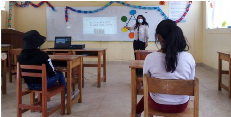
IMAGEN N° 13: Investigadora realizando clases presenciales