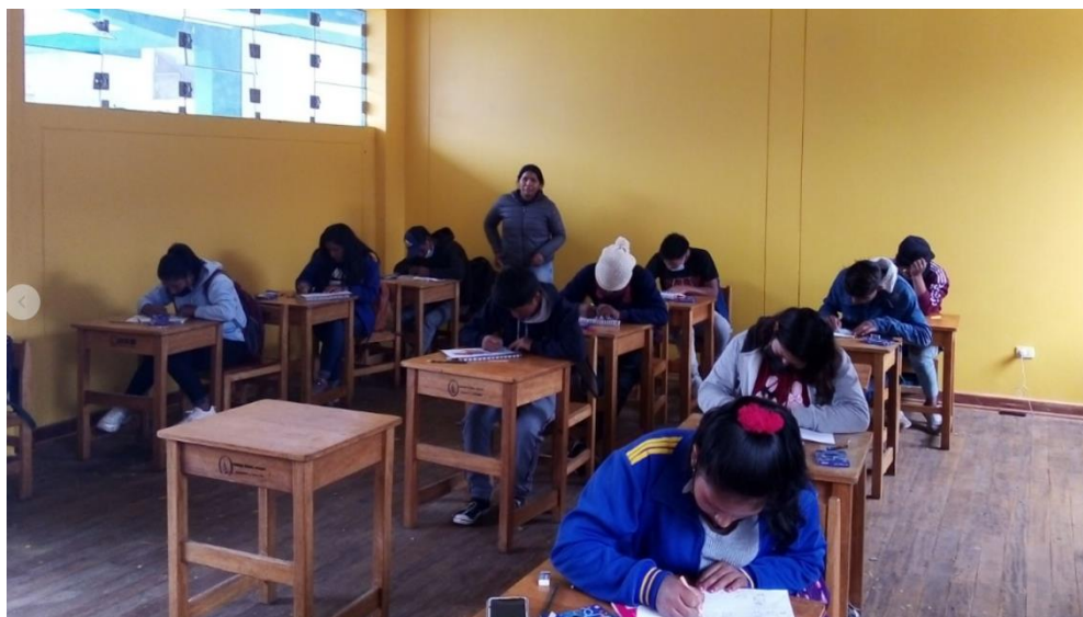
IMAGEN N° 14: Desarrollando clases prácticas