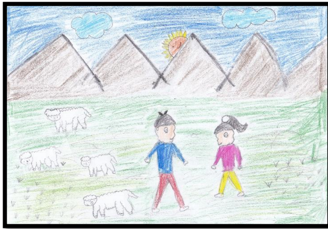
IMAGEN N° 7: Tema: "La amante de la serpiente"