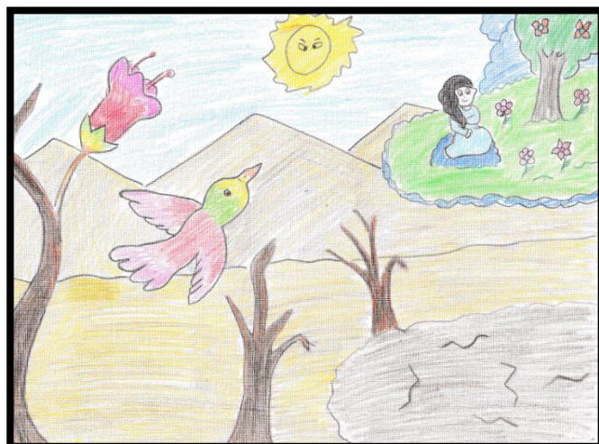
IMAGEN N° 12: Tema: "El amaru"