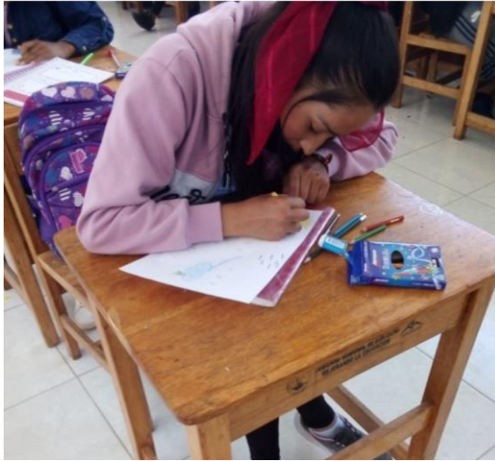
IMAGEN N° 16: Estudiante trabajando