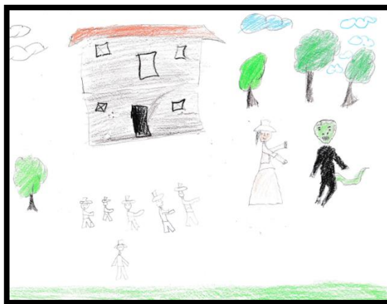
IMAGEN N° 8: Tema: "El lagarto"