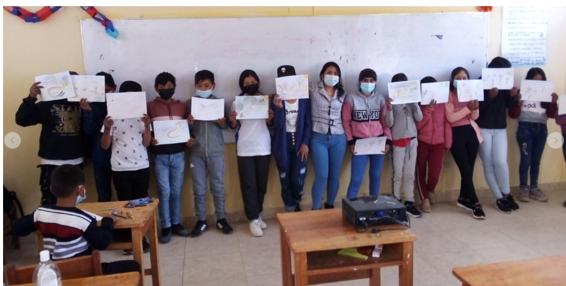
IMAGEN N° 15: Estudiantes mostrando sus trabajos artísticos realizados