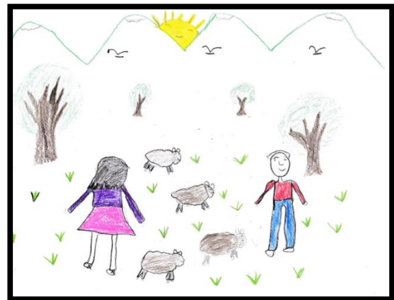
IMAGEN N° 9: Tema: "La amante de la serpiente"