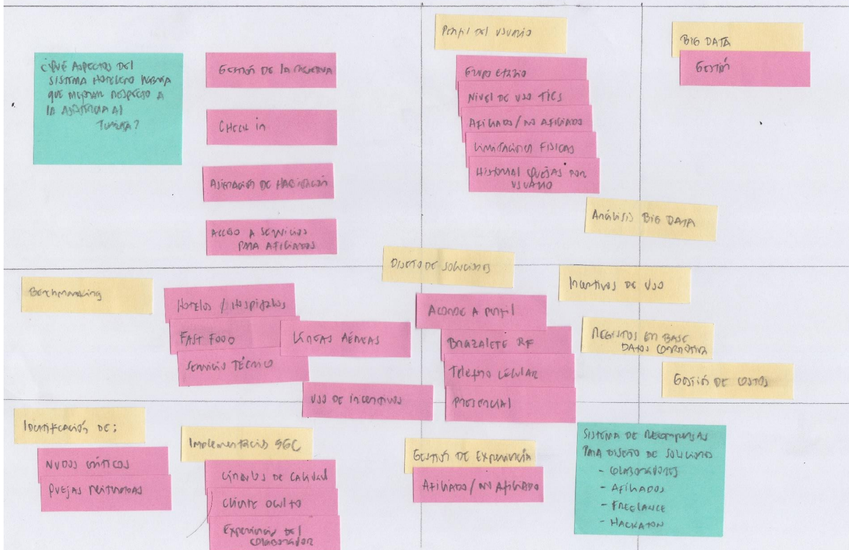
DIAGRAMA DE ACTIVIDAD