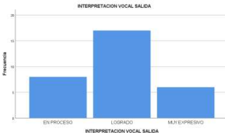
Figura 4 DIAGRAMA DE BARRAS DESPUES DE APLICAR LA VARIABLE MOTIVACION

Interpretación: De acuerdo a lo que podemos observar el 25,8% de estudiantes se encuentran en la condición de en proceso en la dimensión de interpretación vocal, el 54,8% se encuentra en condición de logrado y el 19,4% en condición de muy expresivo esto después de aplicar la variable de motivación en el desarrollo de los talleres de canto de los estudiantes del 2do grado de educación primaria de I.E. MARTÍN LUTERO DE JULIACA.