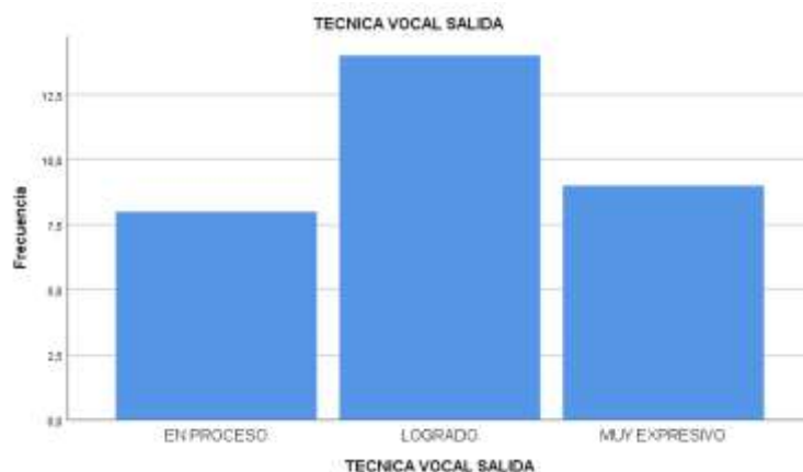
Figura 2 DIAGRAMA DE BARRAS DESPUES DE APLICAR LA VARIABLE MOTIVACION

Interpretación: De acuerdo a lo que podemos observar el 25,8% de estudiantes se encuentran en la condición de en proceso en la dimensión de técnica vocal, el 45,2% se encuentra en condición de logrado y el 29,0% en condición de muy expresivo esto después de aplicar la variable de motivación en el desarrollo de los talleres de canto de los estudiantes del 2do grado de educación primaria de I.E. MARTÍN LUTERO DE JULIACA.