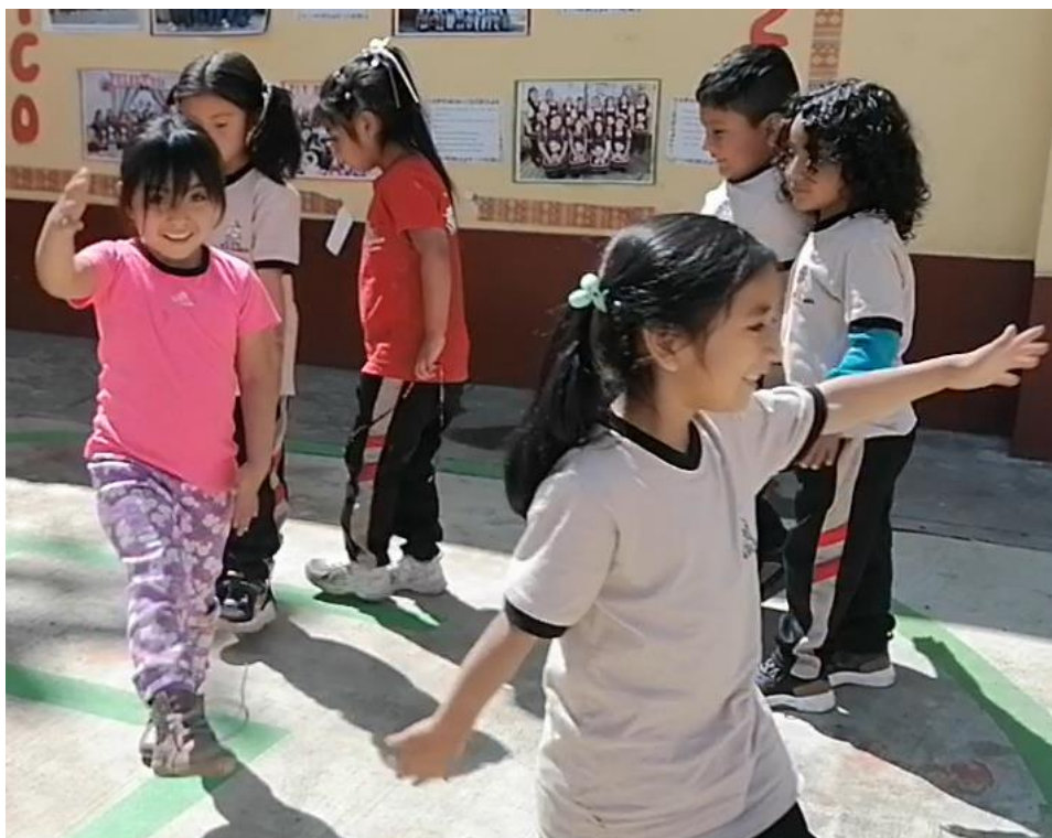
Imagen 1: Niños marchan mostrando coordinación al momento de alternar sus piernas y brazos