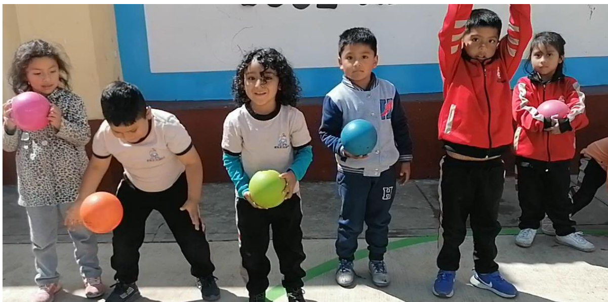
Imagen 3: Niños lanzan el balón y cogen al rebote la pelota