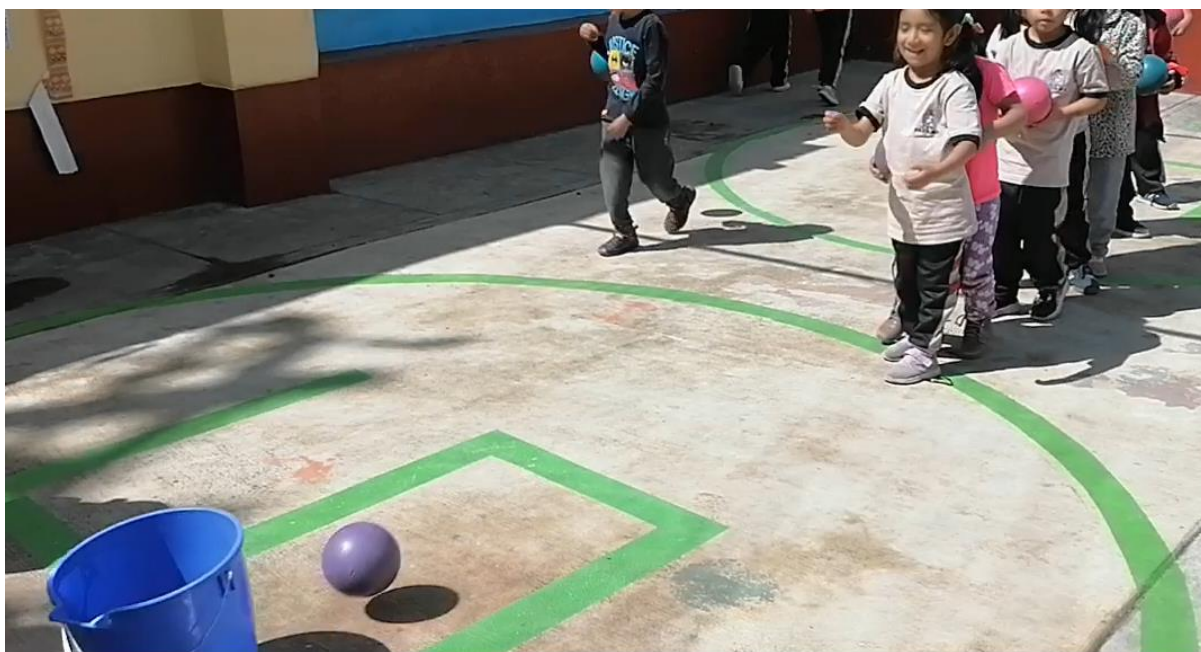
Imagen 4: Niños arrojan la pelota a un balde