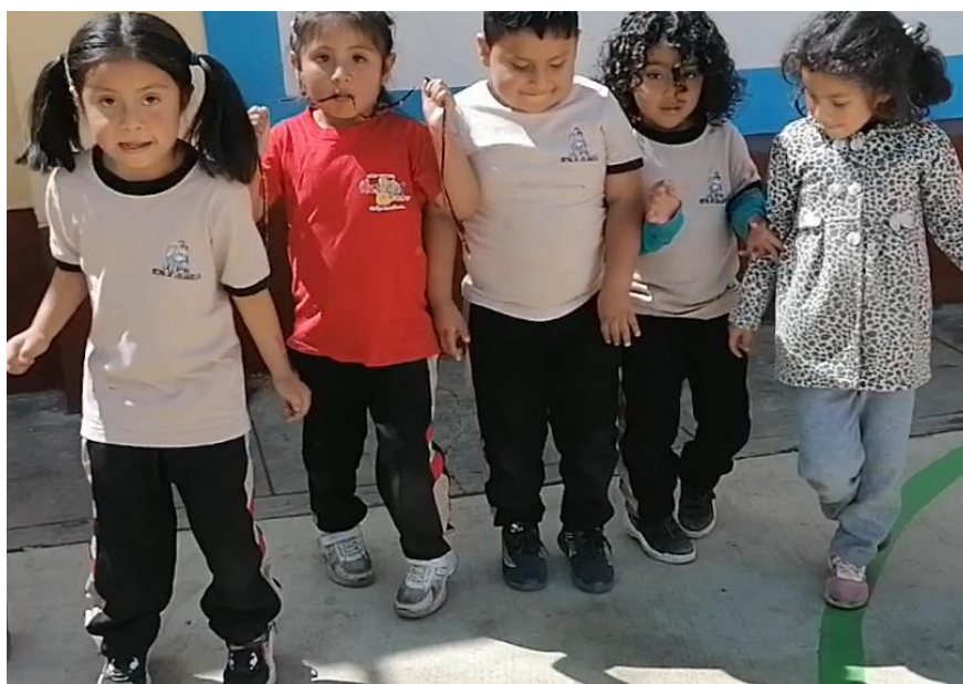
Imagen 2: Niños caminando de puntillas