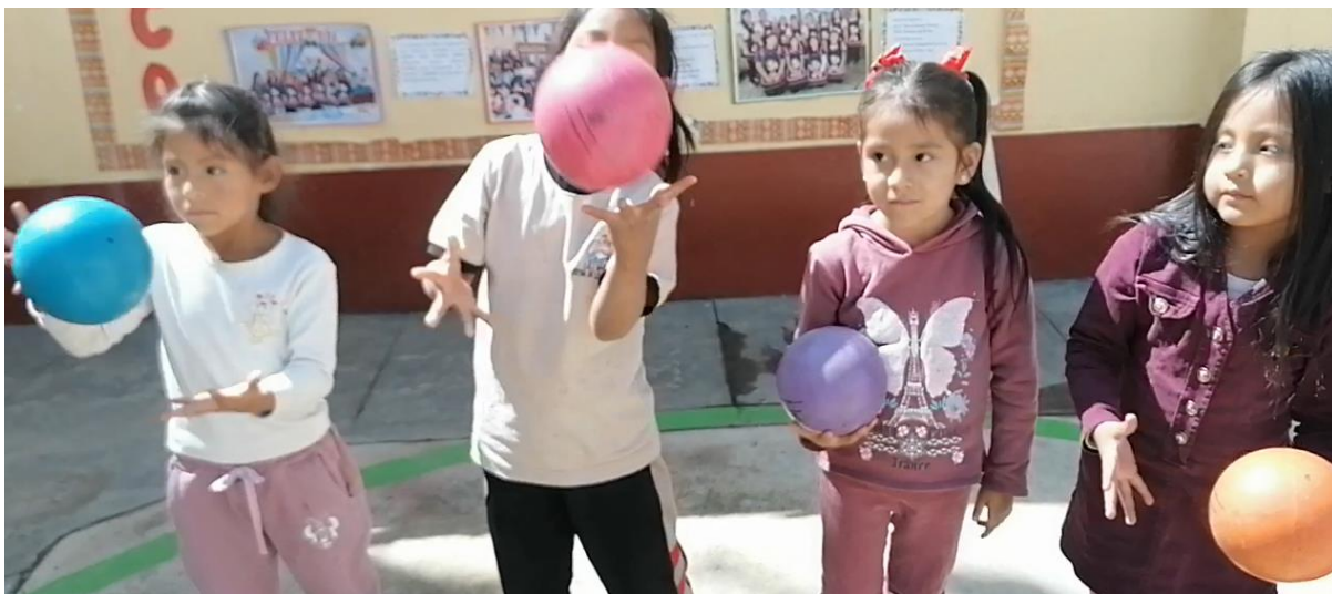
Imagen 5: Niños alternan arrojando una pelota con mano derecha e izquierda.