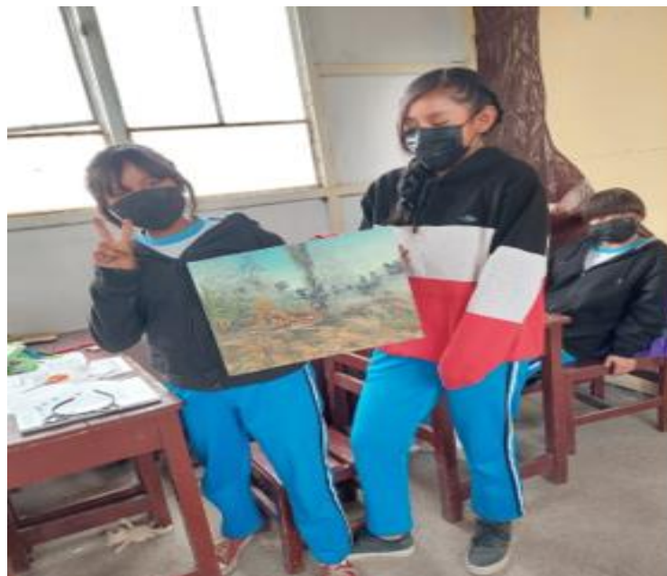
Nota. Evidencia del trabajo pictórico con la tempera.

Así mismo dentro de la técnica de la pintura se puede encontrar otras técnicas y estilos que un artista pueda dominar. Para la presente investigación se utilizó la tempera, una de las razones fue por el bajo costo, la facilidad que tiene en el uso, fácil mezcla y sobre todo porque no es nocivo para la salud de los estudiantes.