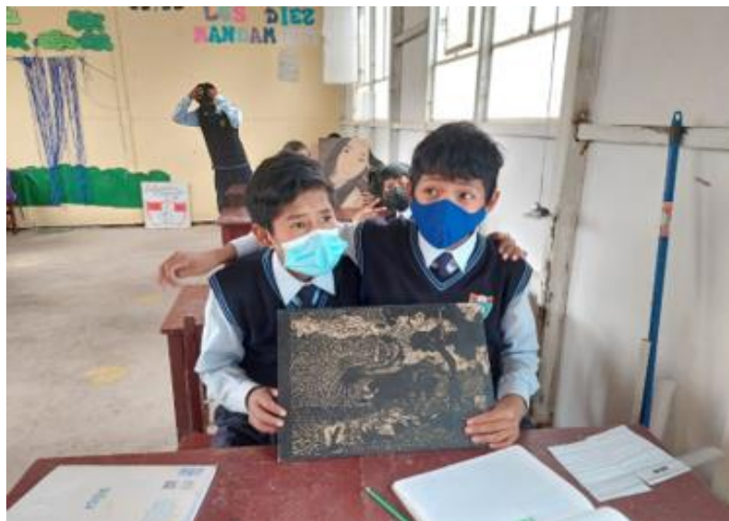
Nota. Evidencia del trabajo pictórico con la tempera.

La xilografía es una técnica artístico plástico dentro de la disciplina del grabado, se caracteriza por ser una técnica de impresión sobre un soporte bidimensional (Mogrovejo, 2020). Se conoce de la xilografía como una técnica más antigua y se ha utilizado ampliamente a lo largo de la historia, especialmente en la producción de libros ilustrados y estampas en el renacimiento, esta favoreció a la divulgación de textos, en la actualidad la xilografía goza de popularidad por tener a muchos artistas y escuelas de arte que la promueven.