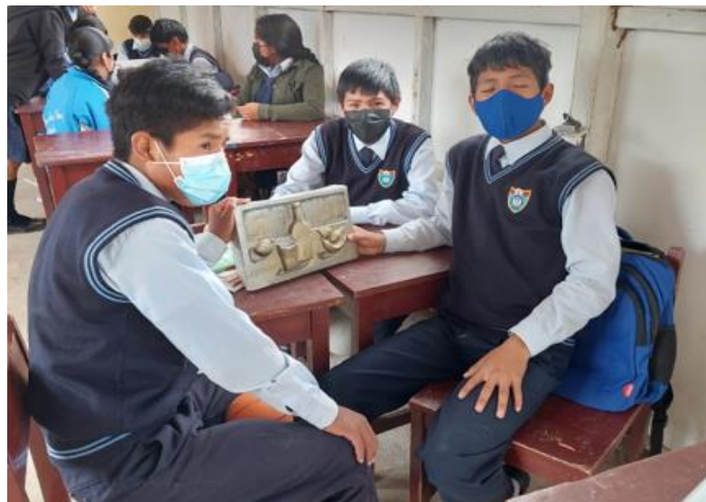
Nota. Evidencia del trabajo pictórico con la tempera.

Técnica escultórica que consiste en esculpir figuras o formas en una superficie plana el cual sobresale y causa una separación del fondo (Mogrovejo, 2020). En esta técnica, las figuras o formas se esculpen con gran detalle y profundidad, creando un efecto tridimensional notable, para este proceso fue necesario armar elementos cotidianos como frutas, botellas, cerámicos, libros entre otros que los estudiantes puedan elaborar sin ningún problema.