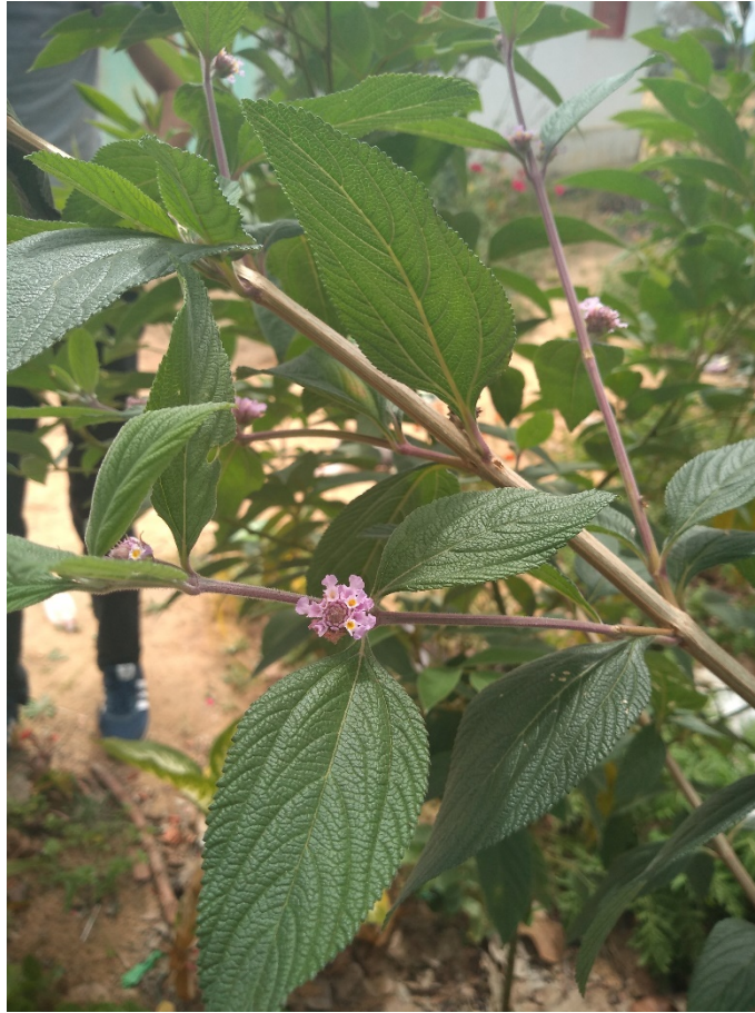
Lippia alba (Mill.) N.E Br :erva cidreira.