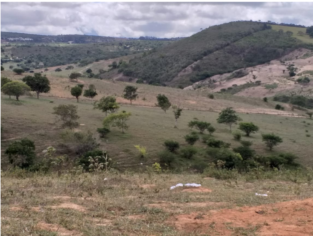
Vista panorâmica das terras da comunidade quilombola Castainho, Garanhus, Pernambuco