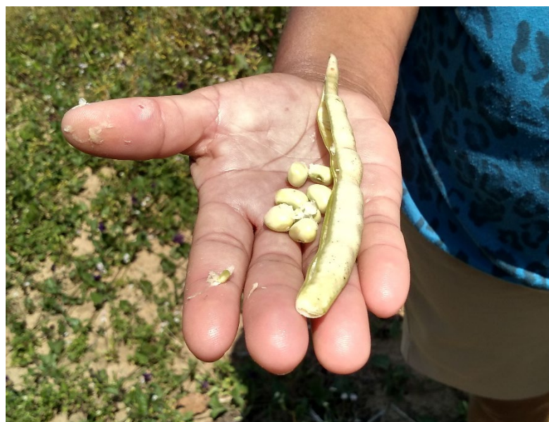
Cajanus cajan (L.) Mill.: guandu, feijão guandu.