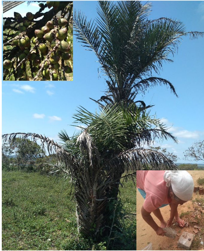
Syagrus coronata (Mart.) Becc: coquinho.