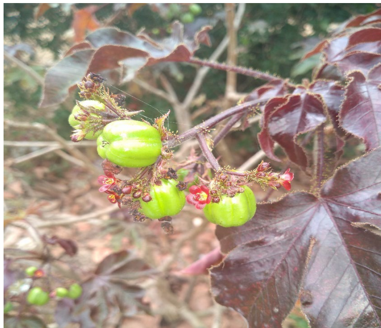
Jatropha gossypifolia L.: pino roxo.