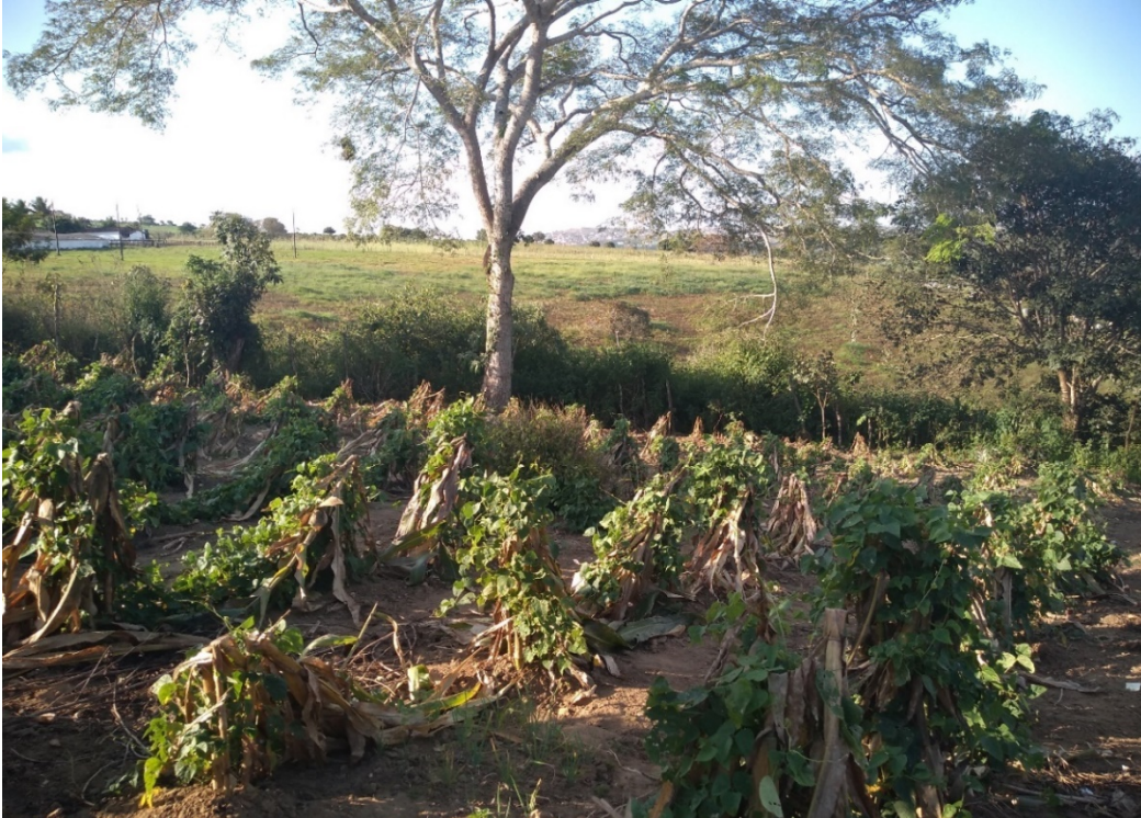
Vista panorâmica de restos de lavouras de milho, comunidade quilombola Castainho, Garanhuns, Pernambuco