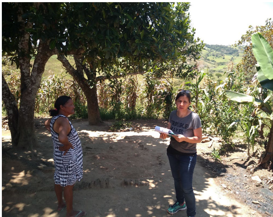
Entrevista com uma moradora da comunidade quilombola Castainho, Garanhuns, Pernambuco