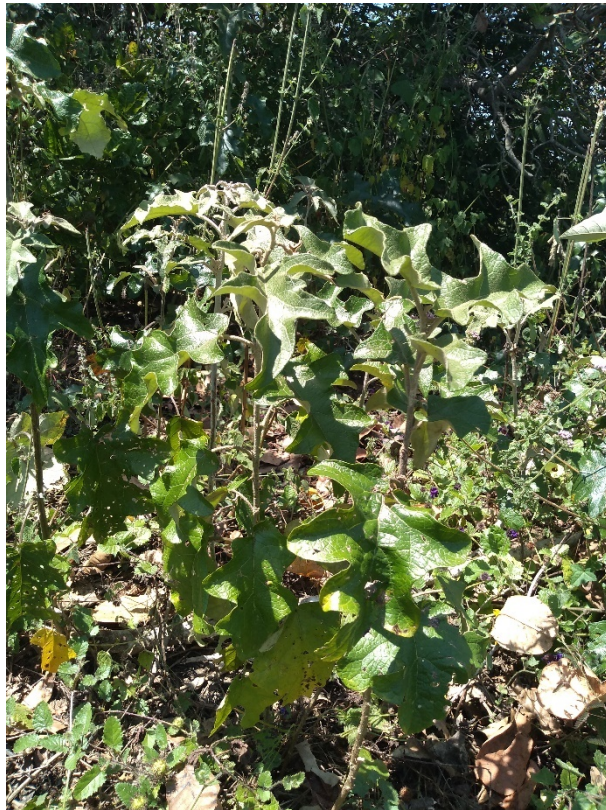
Solanum paniculatum L.: jurubeba.