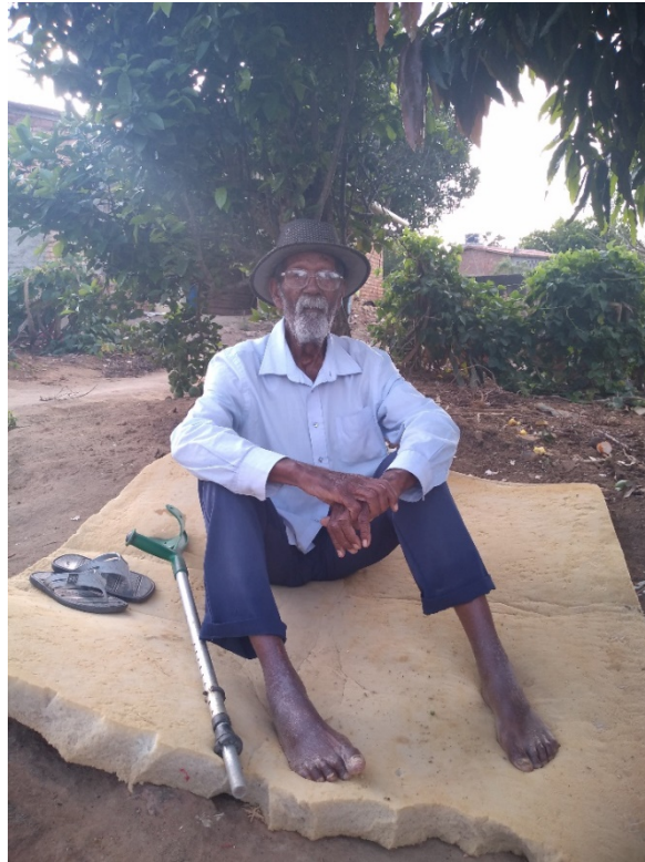
Morador da comunidade quilombola Castainho, Garanhuns, Pernambuco