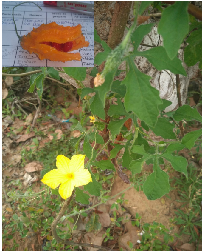
Momordica charantia L.: melão de são caetano.