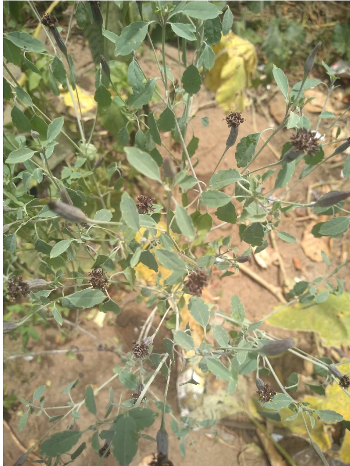
Porophyllum ruderale subsp. macrocephalum DC.: cravo de urubu.