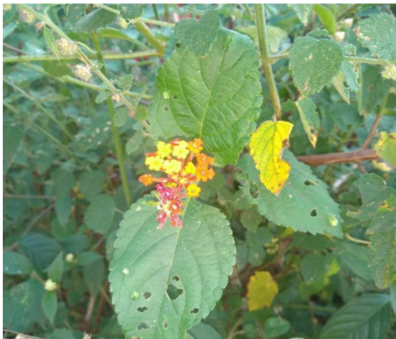
Lantana camara L.: chumbinho.