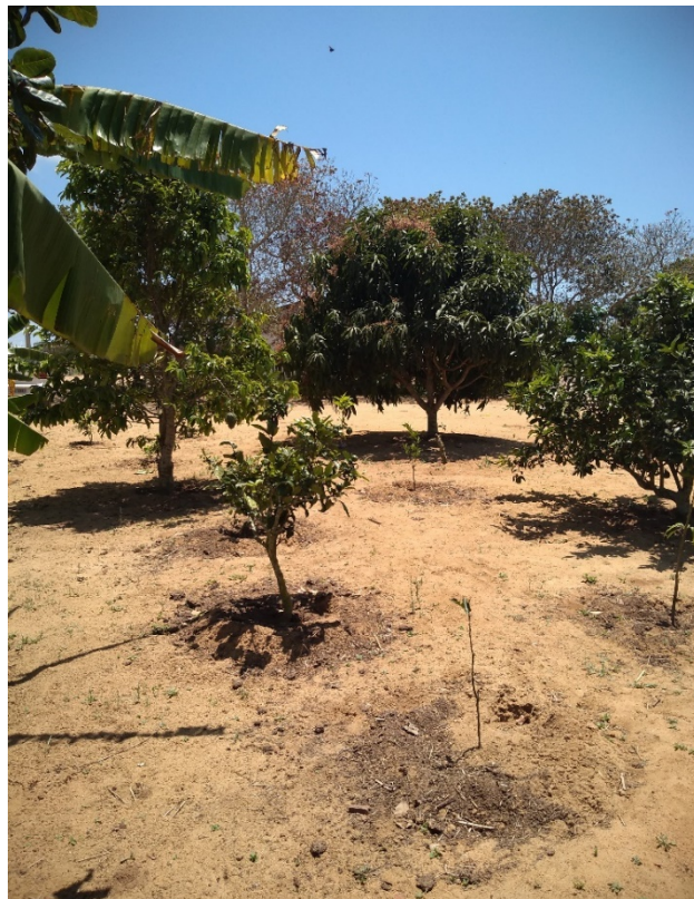
Quintais com diversas frutíferas, comunidade quilombola Castainho, Garanhuns, Pernambuco