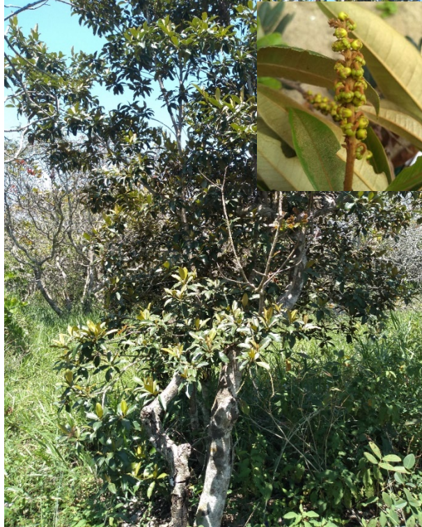
Byrsonima sericea DC.: sarambumba, murici.