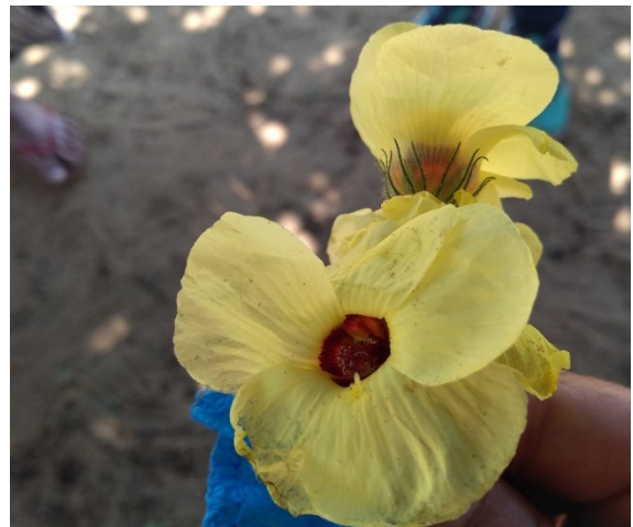
Pavonia cancellata (L.) Cav: chanana.