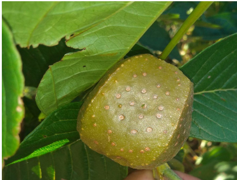
Dioscorea bulbifera L.: cará.