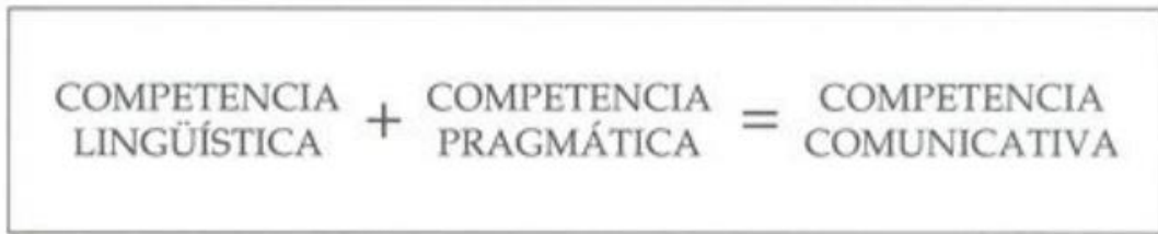
Figura 1. Elementos de la competencia comunicativa

Fuente. Cassany, Luna y Sanz (1998, p. 85)