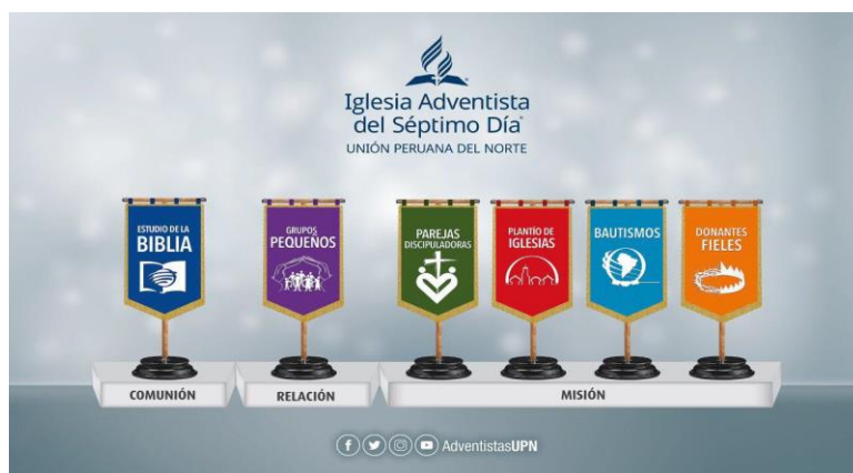
Figura 1. Las 6 metas del discipulado.

Heidinger (2016) propone el plan de las seis metas del discipulado basado en los siguientes principios: “crecimiento integral, causalidad, simplicidad y sinergia”. Además, de una estructura donde se puede ver las seis metas o áreas de crecimiento de las cuales se habla.