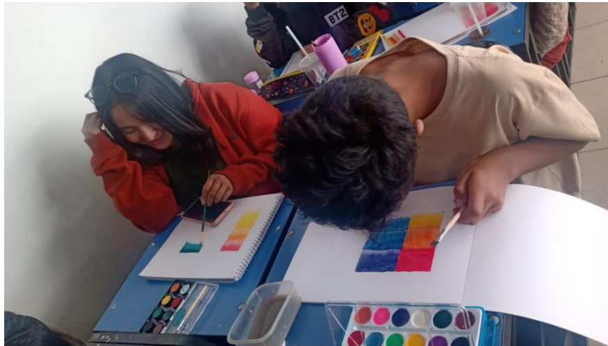
EN PLENO TRABAJO CREATIVO