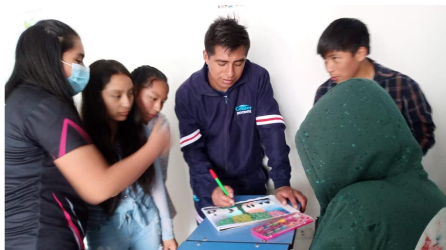
REVISIÓN DE TRABAJOS