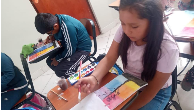
ALUMNA APLICANDO LO APRENDIDO