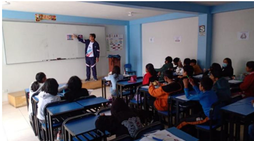
EXPLICANDO LA TÉCNICA