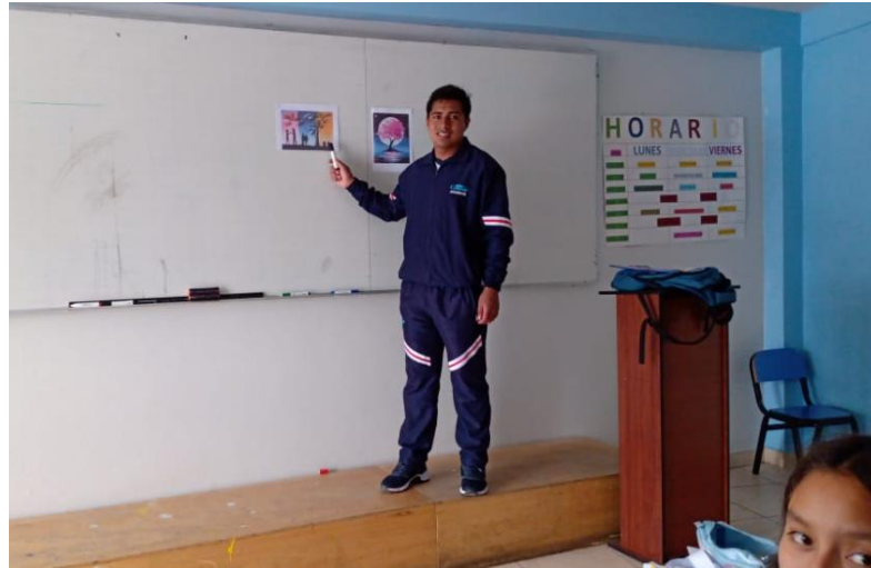
INVESTIGADOR EN CLASES