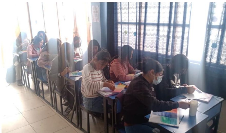
ESTUDIANTES CONCENTRADOS EN SU CREACIÓN PLÁSTICA