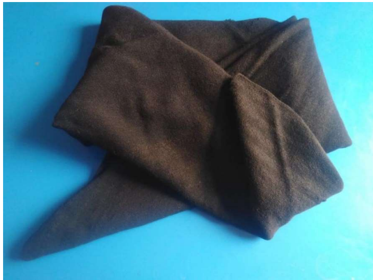
Figura 3 5 Aguayo