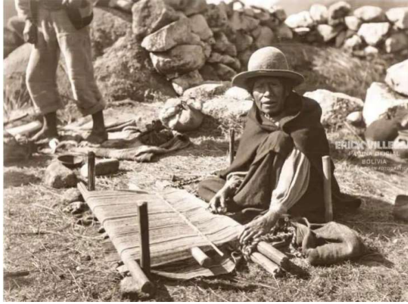
Imagen de la elaboración del tejido