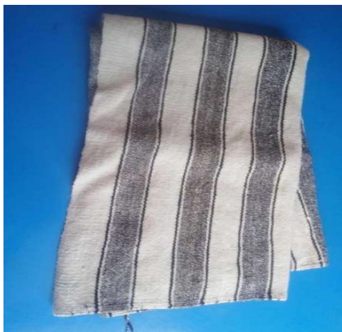
Figura 3 12 Mantiyo