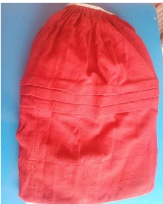
Figura 3 1 Pollera de parte exterior