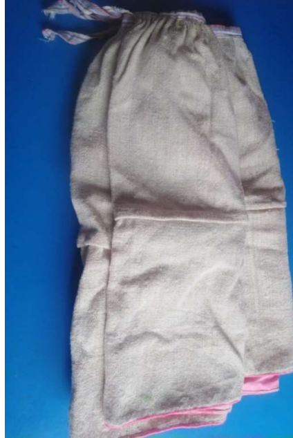
Figura 3 2 La pollera que llevan en parte superior