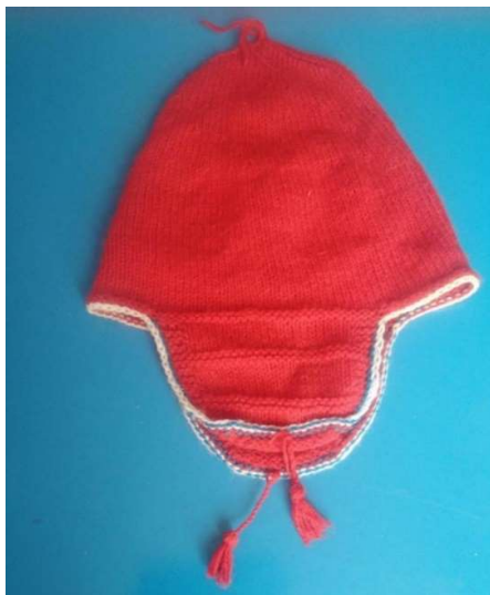
Figura 3 11 Chu'lo