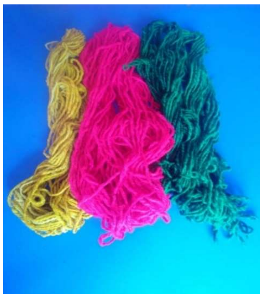
Figura 3 7 juñi ó pita teñida