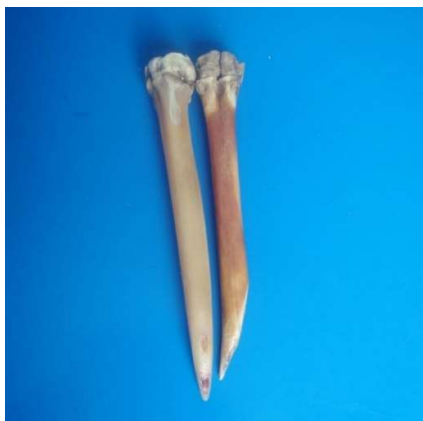
Figura 3 6 Wichu'ña