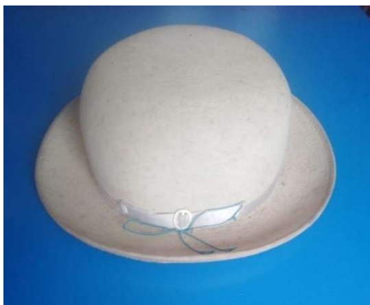
Figura 3 4 sombrero de sawuris