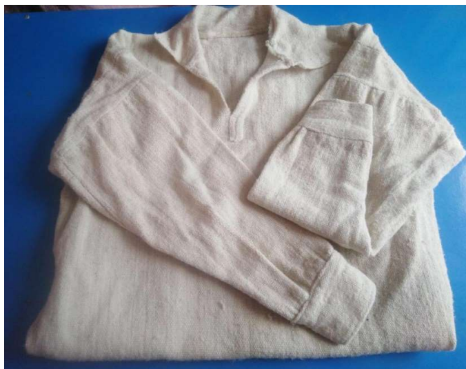
Figura 3 8 Almilla