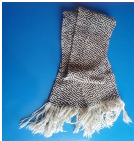
Figura 3 13Chalina