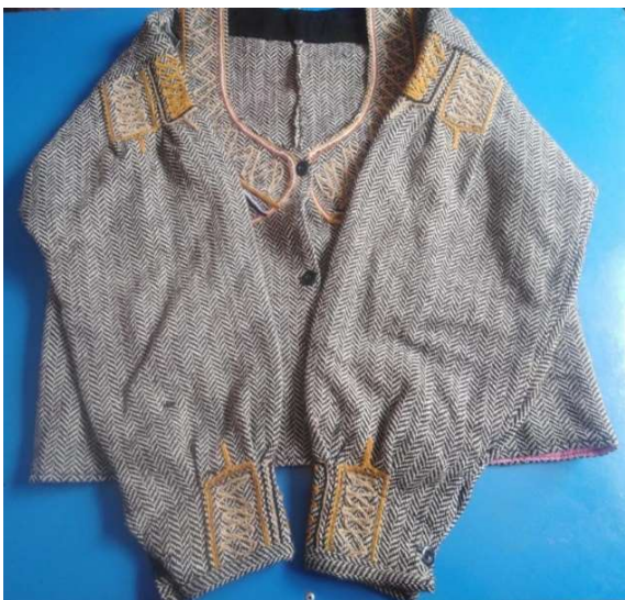
Figura 3 3 jubuna o chaqueta