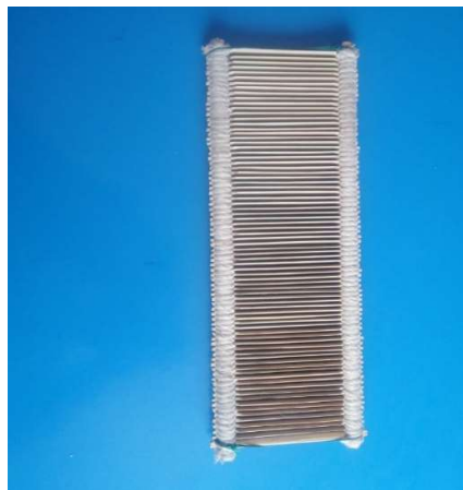
Figura 3 14 Illawa