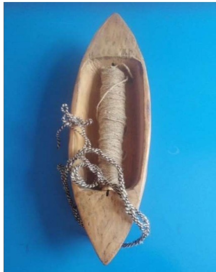
Figura 3 15 Lanzadera