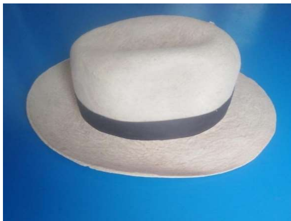
Figura 3 10 sombrero de varón