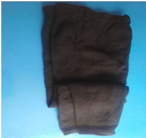
Figura 3 9 pantalón