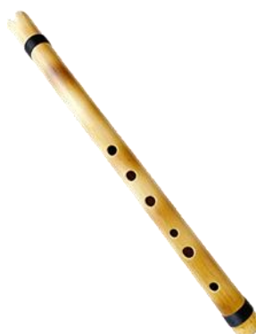
Figura 18. El quenacho de varón