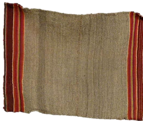
Figura 5. Inkuña

Fuente: Karla Fabiola Moscoso Molina / inkuña aymara