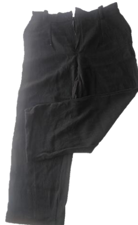
Figura 13. El Pantalón de varón en bayeta.