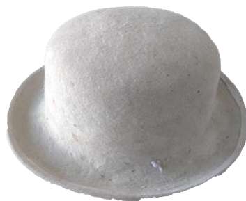
Figura 1. Sombrero de Mujer.