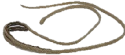
Figura 15. K´orawa.