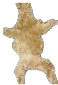
Figura 4. Cuero de vicuña de mujer.