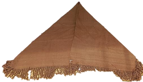
Figura 3. Manteo de mujer.