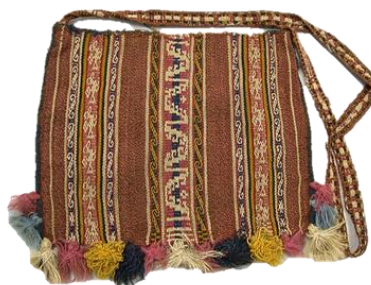
Figura 16. Chuspa de varón