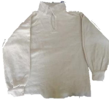
Figura 11. Almilla de varón.