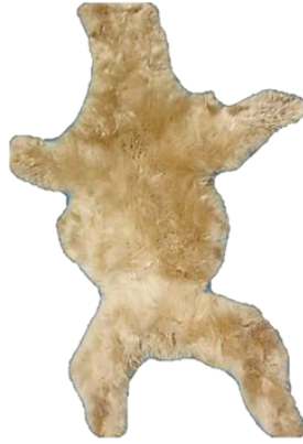
Figura 12. Cuero de vicuña del varón.