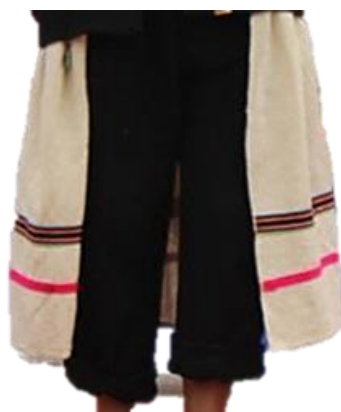
Figura 17. Faldilla o faldón de varón