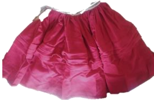
Figura 7. - Pollera de Color Fucsia.