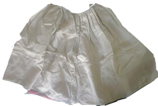
Figura 6. - Phistus o Enaguas de la Mujer.