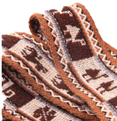
Figura 14. La Fajas del varón.

/Faja Aymara