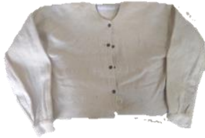
Figura 2. Chompa o almilla de mujer.