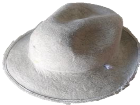
Figura 9. Sombrero del varón.