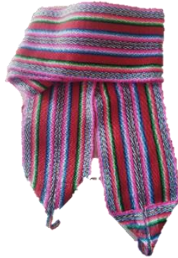
Figura 8. - Fajas de Varón y Mujer.