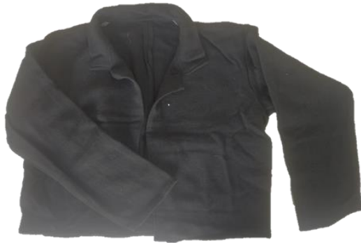
Figura 10. Sacón o la chaqueta del varón.