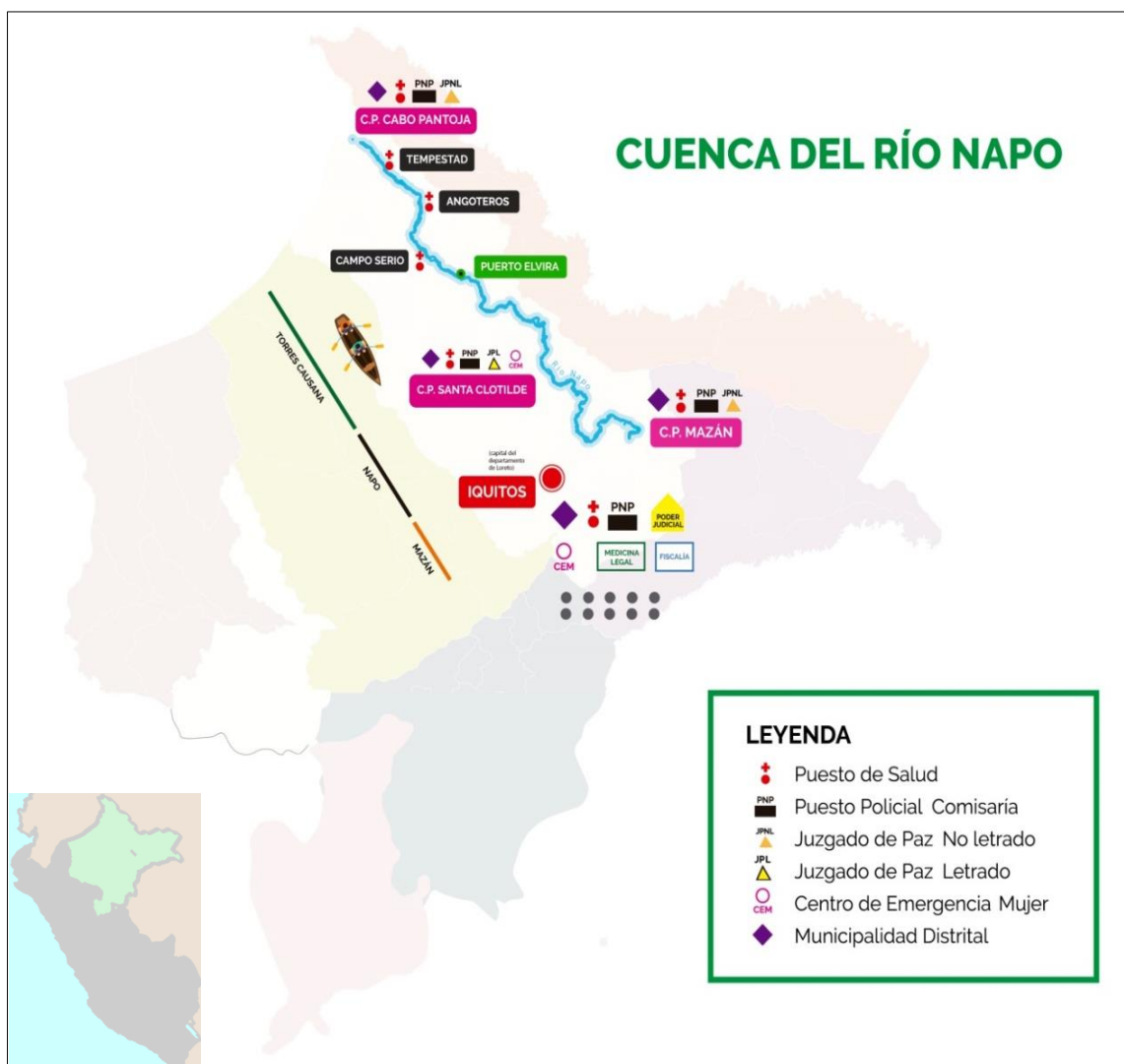
Mapa 1. Región de Loreto, instituciones en la cuenca del río Napo, elaborado por Milena Justo Nieto (ubicación de instituciones) y Christian Allanta Justo (ilustración digital) a partir de mapa del INEI, 2019.

En relación a las instituciones de justicia, se cuenta con un juzgado de paz no letrado y una comisaría ubicados en la capital de distrito, se debe llegar a Iquitos para acceder a los servicios de la Fiscalía y Poder Judicial. El distrito vecino (Napo) cuenta con un juez de paz letrado que tiene jurisdicción en toda la cuenca, sin embargo su carga procesal se centra en el centro poblado de Santa Clotilde. En específico en el distrito de Torres Causana, la única institución de justicia formal es la Comisaría de Cabo Pantoja.