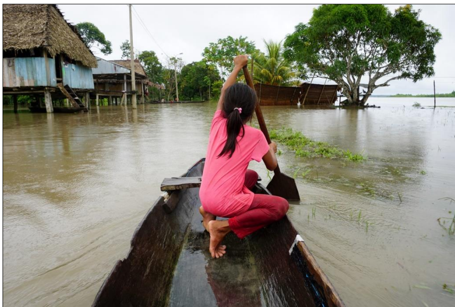
Figura 1. Cruce de sector en la comunidad nativa de Puerto Elvira, fotografía de la autora, junio de 2019.

La comunidad nativa de Puerto Elvira es una de las 27 comunidades del distrito de Torres Causana, cuenta con resolución de reconocimiento 95 y título de propiedad comunal. 96 Está conformada por 55 familias aproximadamente distribuidas en 3 sectores en 7600 hectáreas. Las comunidades vecinas a Puerto Elvira son: para el sur Loroyacu y para el norte Ingano Llacta, siendo las primeras comunidades de la zona conocida como el Alto Napo. Su población es de 320 personas aproximadamente, divididos entre 162 hombres y 158 mujeres. La lengua materna es el kichwa y el 99.65% de la población la tiene como su lengua materna, 97 en la visita a la comunidad pude constatar que toda la población la domina, niñas/os, adultos y ancianos. Pese a que la mayoría domina además el castellano, el kichwa es la lengua elegida para hablar entre comuneros y es la lengua en la que se saluda: “alli puncha: buenos días”, “alli chichi: buenas tardes”, “alli tutta: buenas noches” acompañado de un toque de sólo la palma de los dedos y apenas un roce de las puntas si el saludo es a las mujeres. Las personas son alegres y desde una