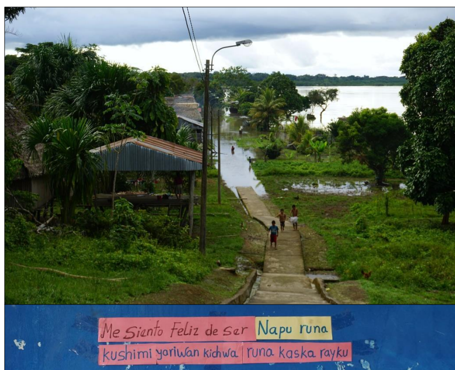
Figura 2. Fotografía compuesta: Pista de la comunidad nativa de Puerto Elvira y pared de un aula de la Institución Educativa Primaria, julio de 2019.

No obstante, al margen del conocimiento previo de la zona y las problemáticas de la Amazonía, la visita a la comunidad como investigadora y sin los recursos laborales o del activismo, demanda un esfuerzo mayor, que debe estar acompañado de una metodología pertinente y acotada a la población.