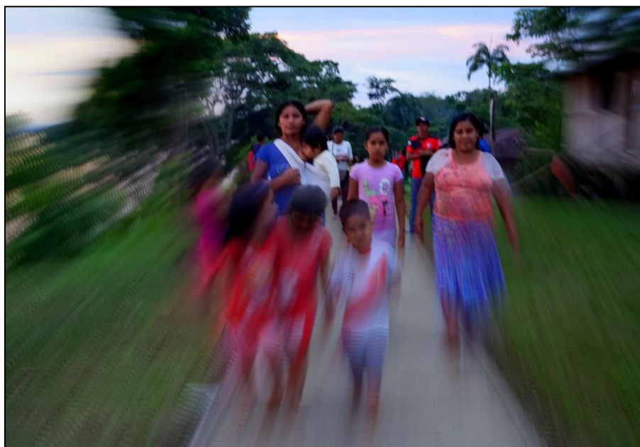
Figura 3. Mujeres kichwas del Alto Napo, fotografía de la autora, julio de 2019.

“El feminismo ha descentrado el derecho, generando un nuevo focus que no es la norma jurídica, sino las relaciones sociales”. 211 Sobre las relaciones sociales que aportan al derecho en el establecimiento de la justicia se explorará en el presente acápite. Se concuerda con Zaffaroni cuando refiere que, en países sudamericanos –como el Perú–, se hace cada vez más evidente la necesidad del desarrollo de una teoría