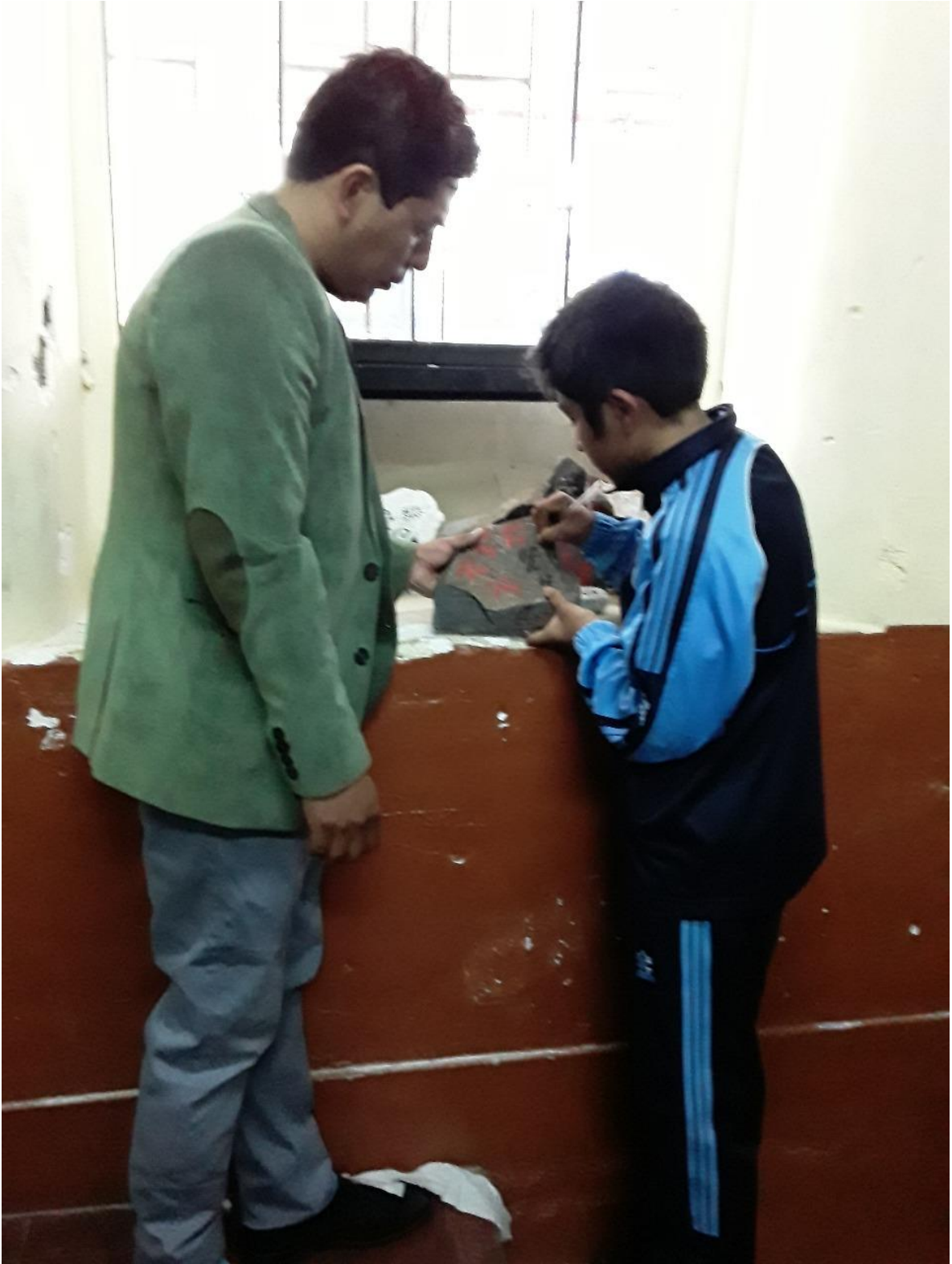
Investigador explicando al estudiante los trabajos a realizar.