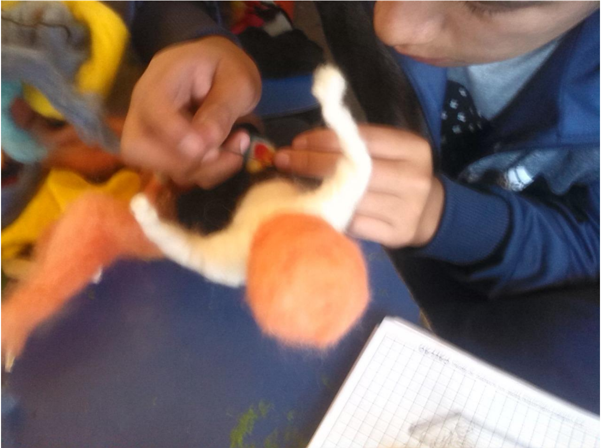
Estudiantes manipulando los materiales durante las sesiones de clases programadas.