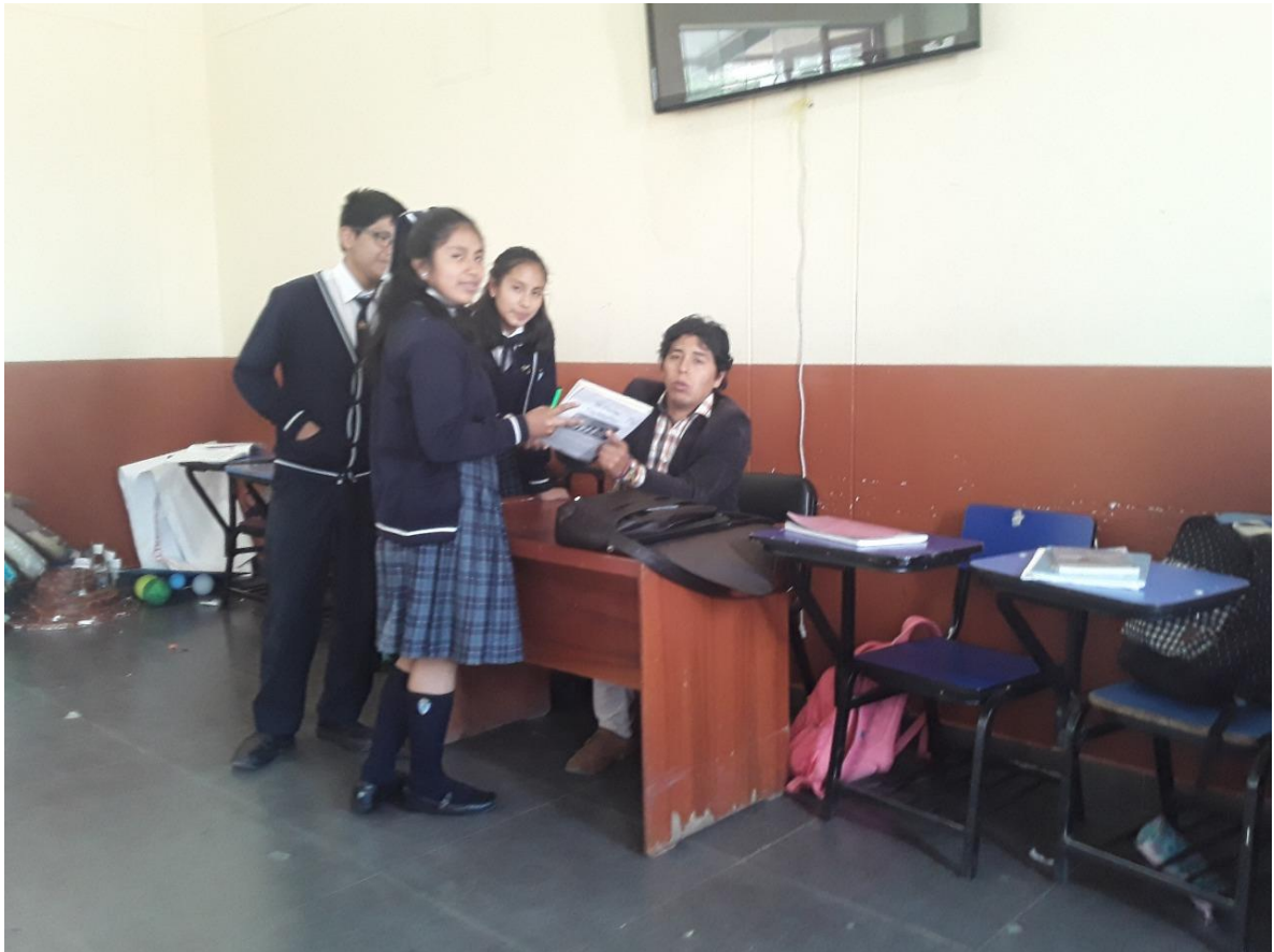
Investigador explicando a los estudiantes sobre los trabajos a realizar.