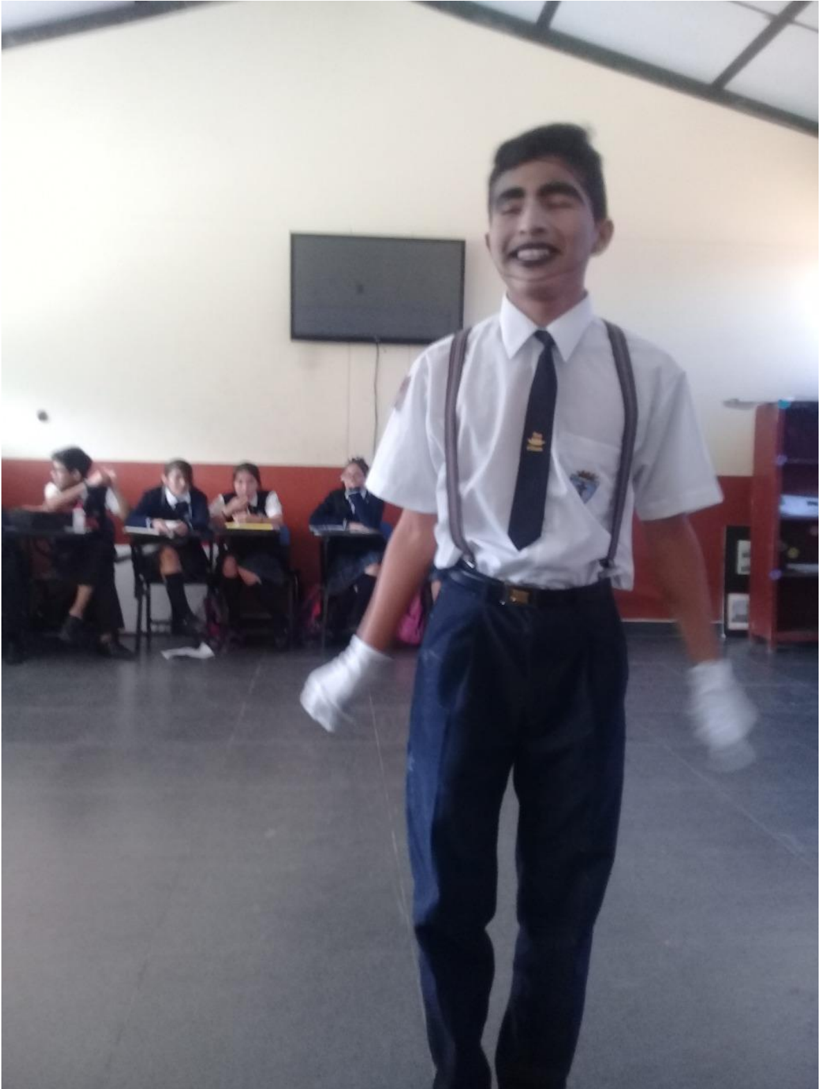
Estudiante realizando una presentación pantomímica.