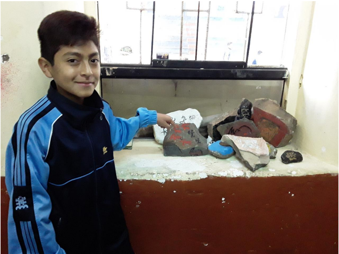
Estudiante identificando materiales de trabajo.