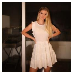
2021 Vestido Esperanza S/155.00 S/93.00