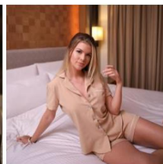
2021 Pijama Dulce de Leche (Set Completo) S/129.00 S/85.00