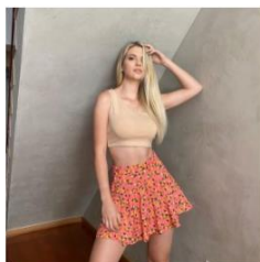
2021 Falda Short Florida (Coral) S/55.00 S/45.00