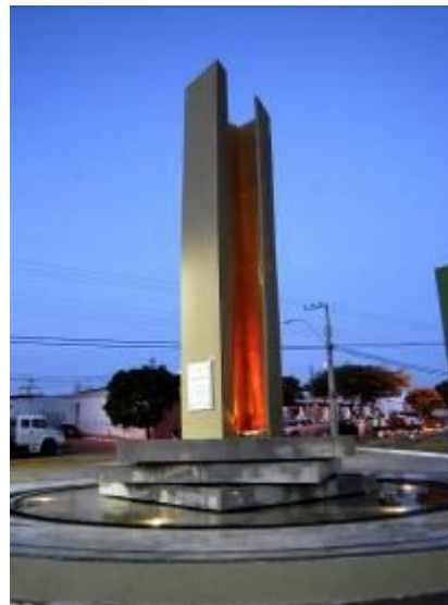
Figura 04 - Marco Zero no Parque da Cidade.