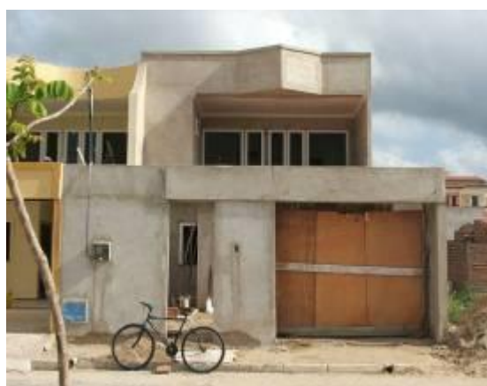
Figura 12 – Novas construções as margens do Parque da Cidade.