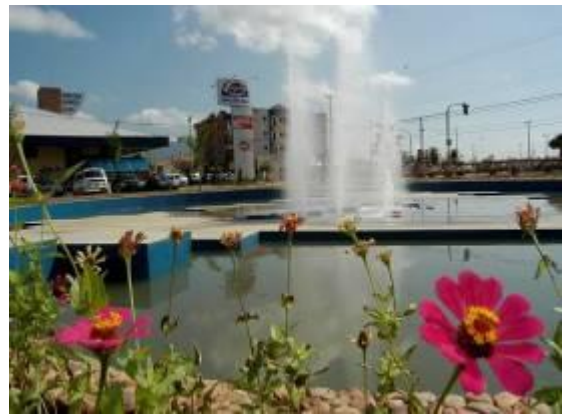
Figura 02 - Fonte Central da Praça João Dias.