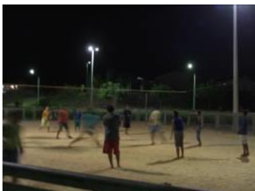
Figura 23 – Jovens jogando vôlei nos campos de areia.