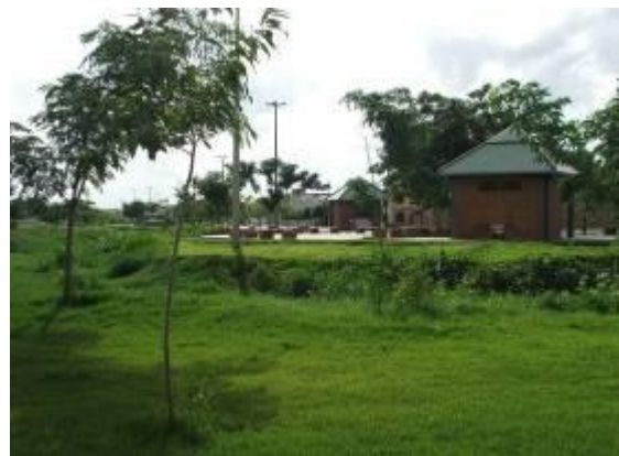
Figura 06 - Quiosque e vegetação.