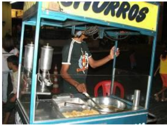
Figura 18 – Comércio informal no ramo da alimentação.