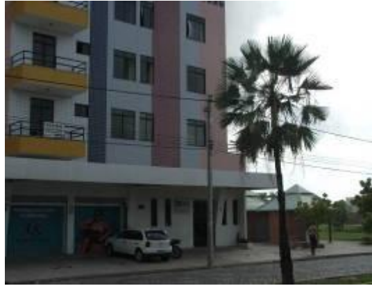
Figura 14 – Prédio comercial e residencial. no entorno do parque.