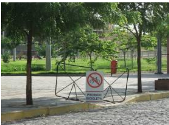
Figura 09 - Placa de proibição de trânsito de bicicletas na calçada do parque.