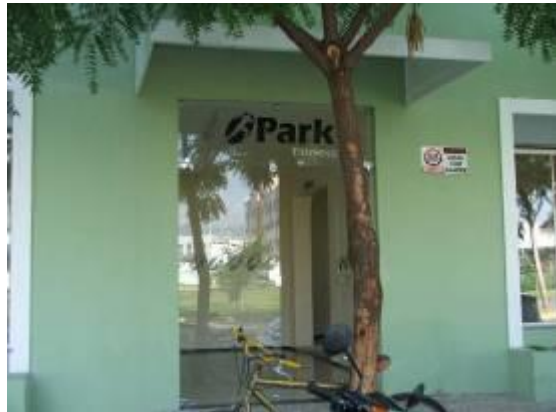
Figura 16 – Comércio no entorno do parque Academia “Park Fitness”.