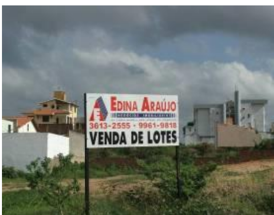
Figura 11 – Especulação imobiliária no entorno do Parque da Cidade.