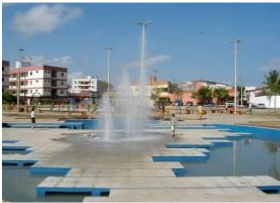
Figura 01 - Fonte Central da Praça João Dias.