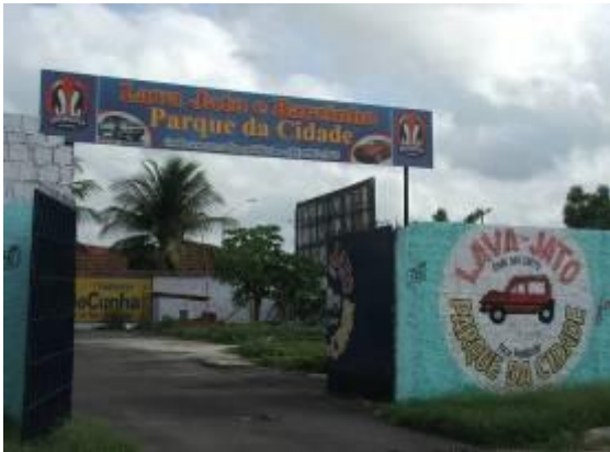
Figura 15 – Comércio no entorno do parque “Lava Jato e Barzinho Parque da Cidade”.