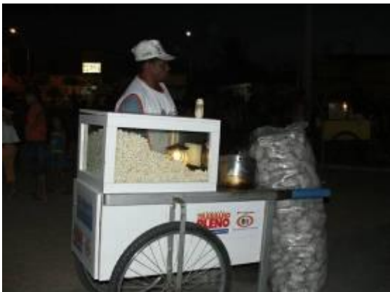
Figura 17 – Pipocueiro na Praça João Dias.