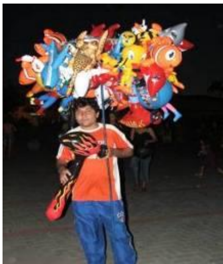
Figura 19 – Vendedor ambulante de brinquedos (Dia das Crianças).