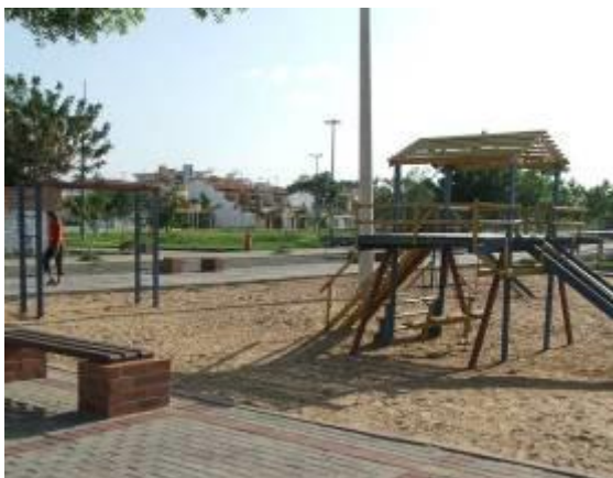
Figura 07 – Playgrounds.