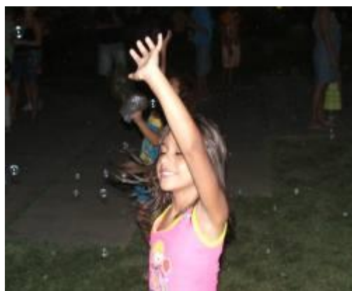
Figura 22 – Menina brincando com bolhas de sabão na Praça João Dias.