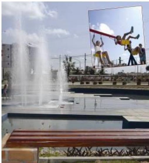
Figura 03 - Crianças brincando.