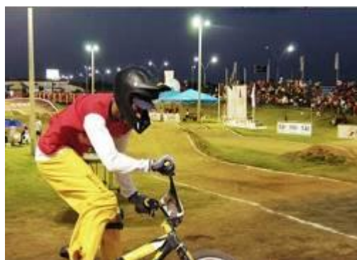
Figura 24 – Campeonato de Bicicross.