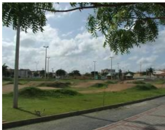
Figura 10 – Pista de Biccross Race.