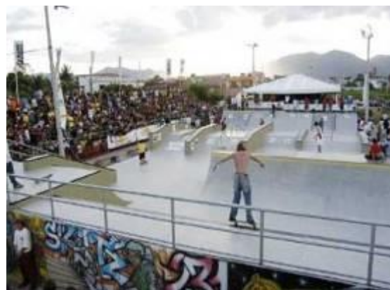
Figura 26 – Campeonato Nacional de Skate.