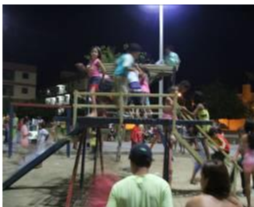
Figura 21- Crianças brincando no playground da Praça João Dias.