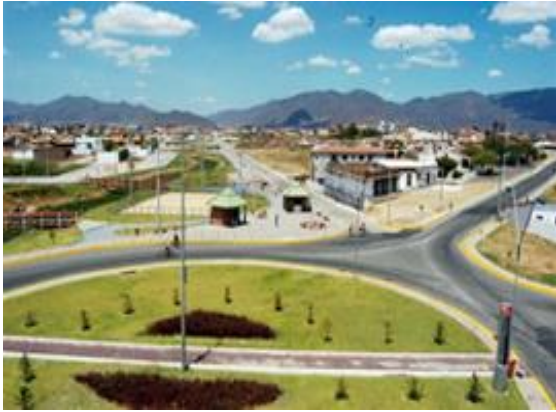
Figura 13 – Anel viário do Parque da Cidade.