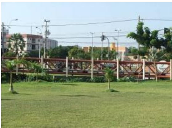
Figura 05 - Ponte do Parque da Cidade.