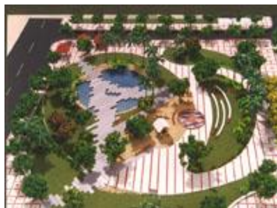
Figura 28 – Maquete da Praça João Dias.