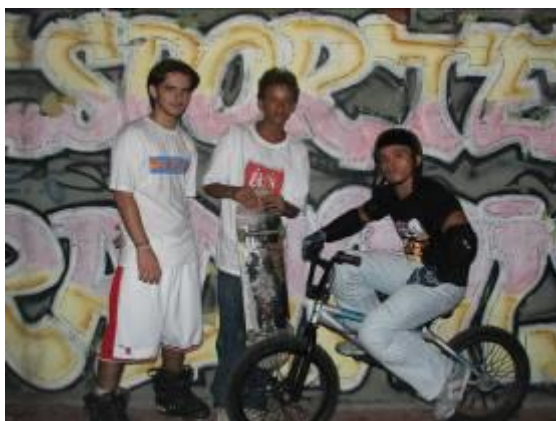
Figura 25 – Skatista, patinador e “crossista”.