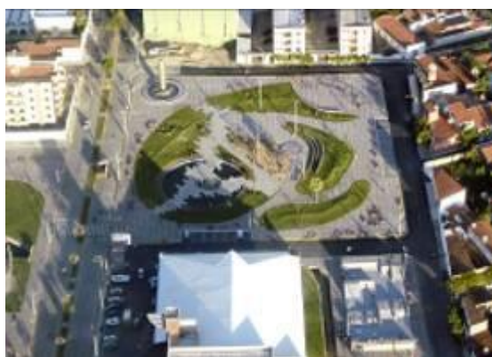
Figura 29 – Vista aérea da Praça João Dias.