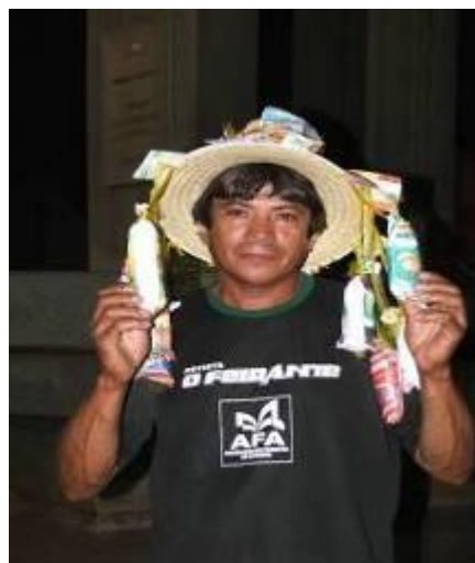
Figura 20 – Vendedor de picolé na Praça João Dias (Dia das Crianças).