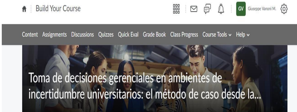
Figura 4: Portada del curso Toma de decisiones

El la figura 4 se observa la portada del curso sobre toma de decisiones en ambientes de incertidumbre universitarios.