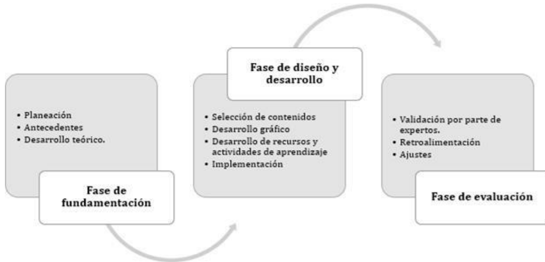
Figura 3: Procedimiento del diseño Metodológico.