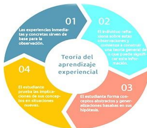
Figura 2. Teoría del aprendizaje experiencial.

De allí que Kolb (1984) desarrolla una teoría de aprendizaje experiencial de cuatro etapas, tal como puede ser visto en la figura 2.