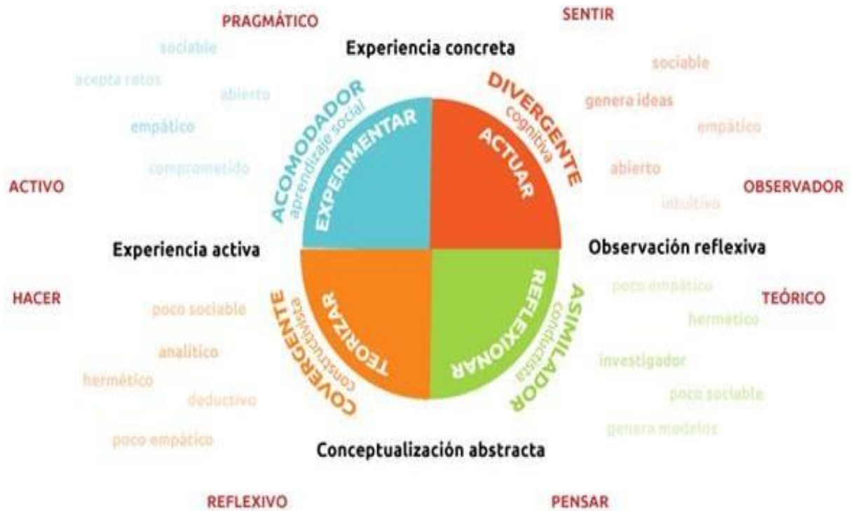
Figura 1. Cuatro estilos de aprendizaje.