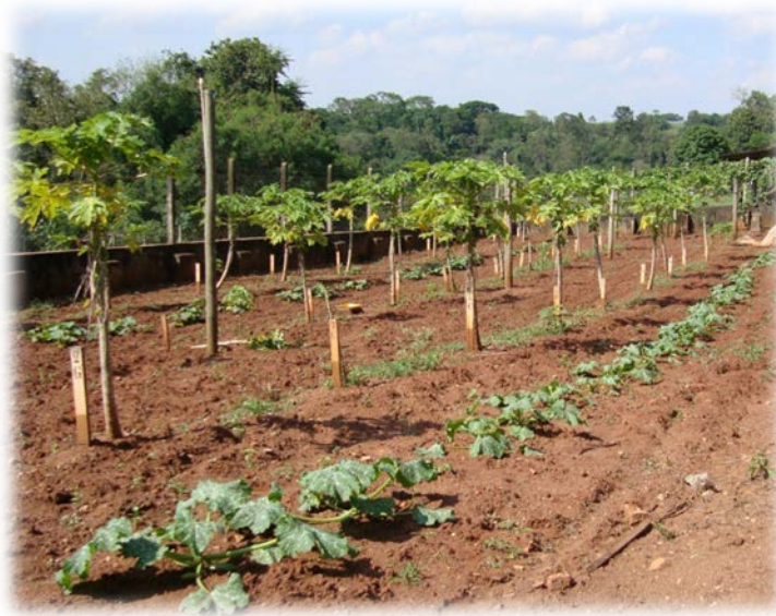
Figura 4 – Abobrinha de moita, melancia e pepino cultivadas entre linhas de mamoeiros infectados com o Papaya ringspot virus – type P, em Piracicaba, SP