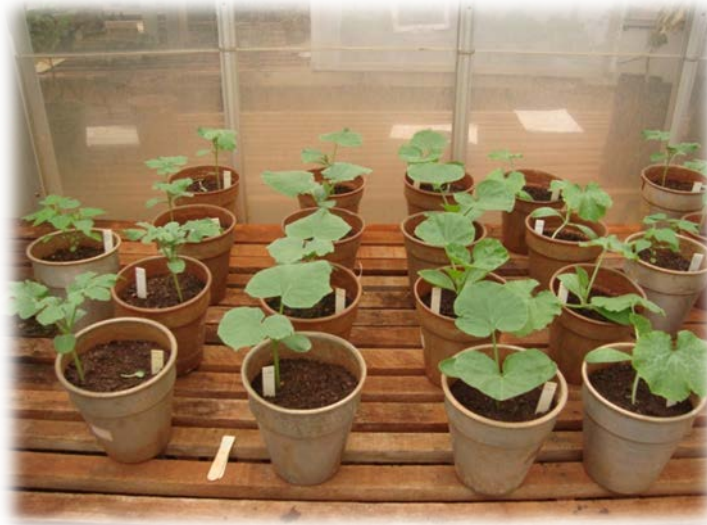
Figura 1 - Mudanças de melancia, pepino, abóbora moranga e abobrinha de moita utilizadas na transmissão mecânica com um dos isolados do PRSV-P

foram inoculadas uma ou duas mudas de mamoeiro da variedade Golden como controle positivo da infectividade dos isolados do PRSV-P (Figura 1).