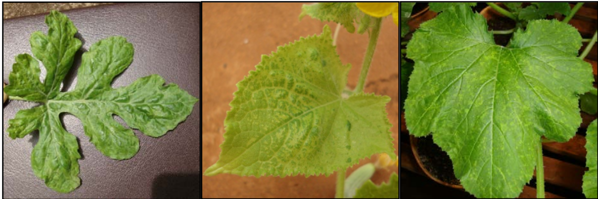
Figura 3 – Sintomas em folhas de melancia, pepino e abobrinha de moita inoculadas mecanicamente com isolado do Papaya ringspot virus – type P

Na figura 3 são apresentadas imagens dos sintomas virais encontrados nas cucurbitáceas susceptíveis ao PRSV-P.