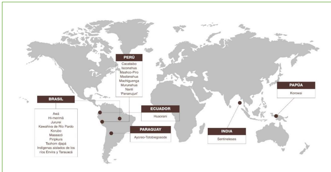
Figura 1. “PIA en el mundo”. (Survival International, 2021b)

Con respecto de los PIAI, se puede afirmar que son pueblos indígenas que, si bien se encontraban en situación de aislamiento, por diversas razones –contactos forzados por terceros, presiones en sus territorios, entre otras–, han entrado en contacto con personas de la sociedad mayoritaria (ACNUDH, 2012, p. 10). Ahora bien, el dejar la situación de aislamiento o de relaciones intermitentes no los coloca en una mejor situación, debiendo ahora afrontar una serie de condiciones bajo las cuales el desarrollo de su vida continuará en estado de extremadamente vulnerabilidad.