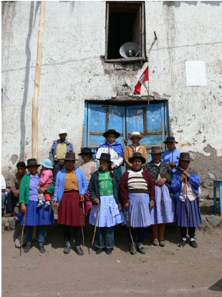
Las Warmi Varayoq