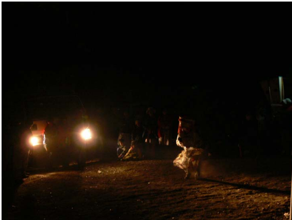
Escena nocturna del pueblo. Al medio, danzante de tijera bailando