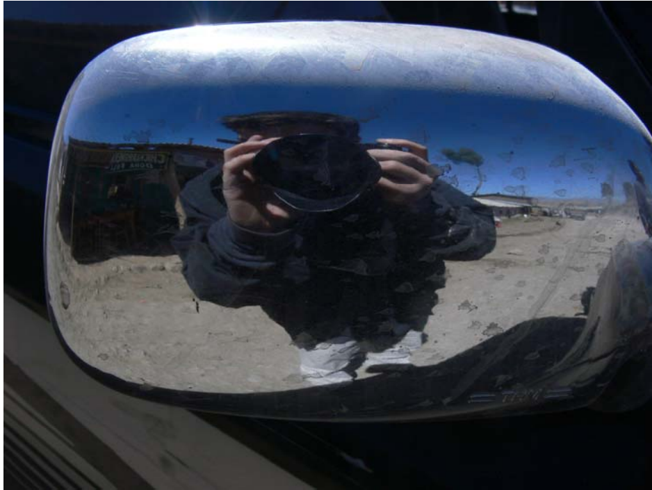
Esen Espinosa, el ojo detrás de las fotos.