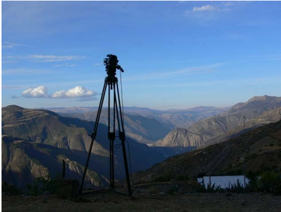
Filmación de un time-lapse 1 durante el rodaje