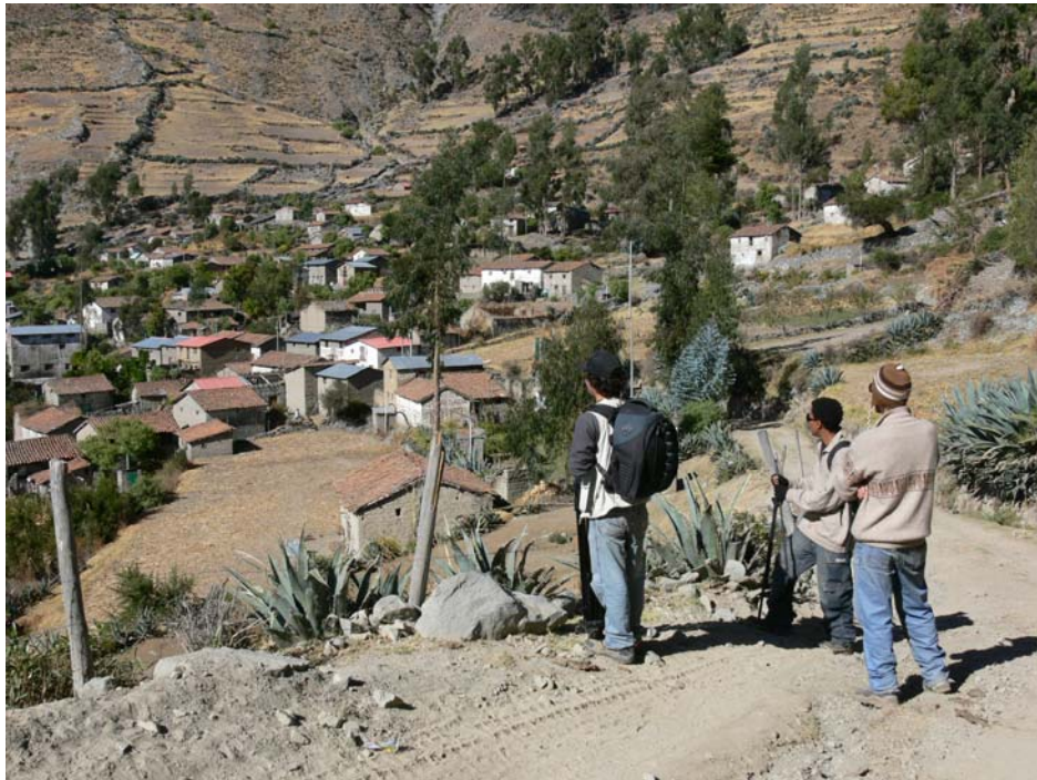
El equipo durante el rodaje. Al fondo, la comunidad.