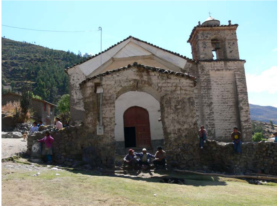
La Iglesia del pueblo