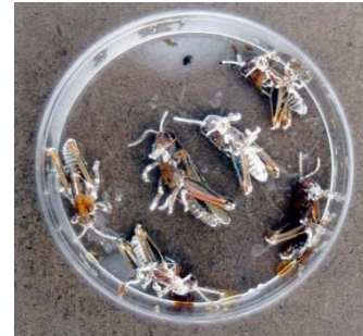
Imagen 8. Insectos parasitados por Beauveria bassiana