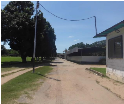
Imagen 9. Instalaciones de la granja

Así se lleva a cabo la enseñanza de 4° a 9° y, a partir de 1985 se le dio el nombre actual: Escuela Básica Granja Padre Gumilla. (Y en los actuales momentos 2015, se está en pleno proceso de una nueva conversión que pasaría de Escuela Primaria Granja a Escuela Técnica Agropecuaria), atendiendo a las demandas y necesidades intelectuales del Estado.