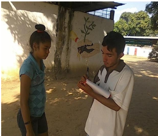
Imagen 03. Entrevista a estudiante del 3er año de bachillerato