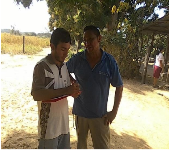
Imagen 01. Entrevista a profesor de la Escuela Granja