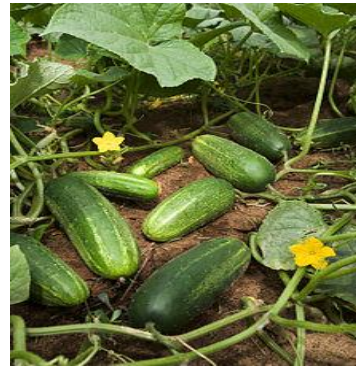
Imagen 6. El Pepino ( Cucumis sativus )

El pepino es una planta anual, monoica, o sea que hay flores femeninas y masculinas en el mismo individuo. El tallo es postrado/rastrero, ramificado, anguloso, hirsuto y con zarcillos. Las hojas son delgadas, con pecíolo de 8 cm, con limbo de 12-18 por 11-12 cm, viloso-hispídulo en los nervios y piloso en ambas caras; su contorno