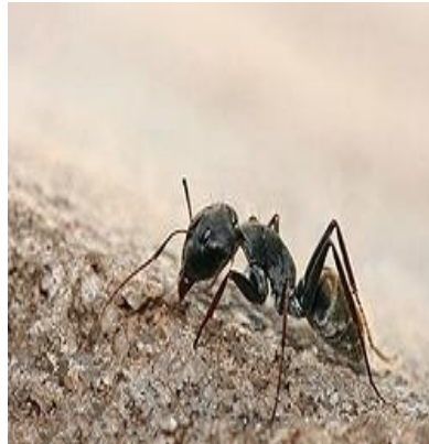
Imagen 5. Hormiga negra ( Lasius niger )

Reino: Animalia Filo: Arthropoda Subfilo: Hexapoda Clase: Insecta Subclase: Pterygota Infraclase: Neoptera Superorden: Endopterygota Orden: Hymenoptera Suborden: Apocrita Infraorden: Aculeata Superfamilia: Vespoidea Familia: Formicidae Género: Lasius Especie: niger