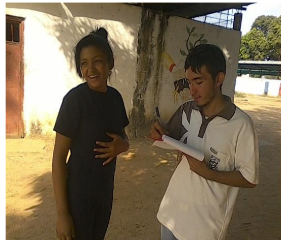
Imagen 04. Entrevista a estudiante del 2do año de bachillerato