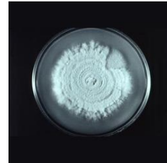
Imagen 7. ( Beauveria bassiana )

Reino: Fungi División: Ascomycota Clase: Sordariomycetes Orden: Hypocreales Familia: Clavicipitaceae Género: Beauveria