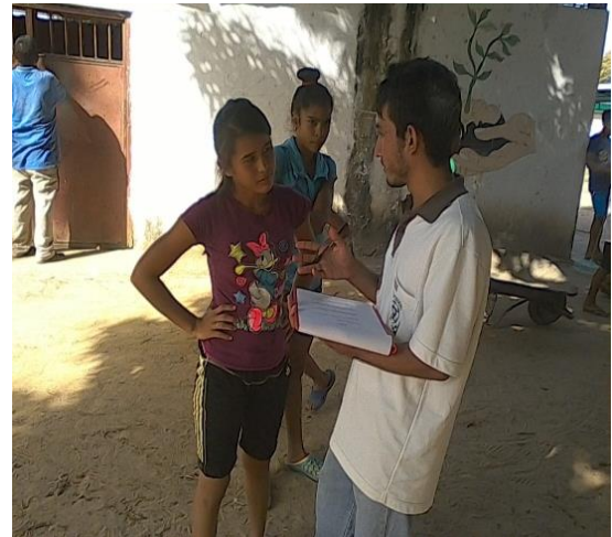
Imagen 02. Entrevista a estudiante del 2do año de bachillerato