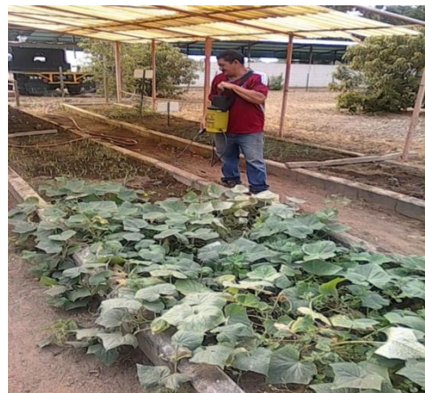
Imagen 10. Áreas de producción