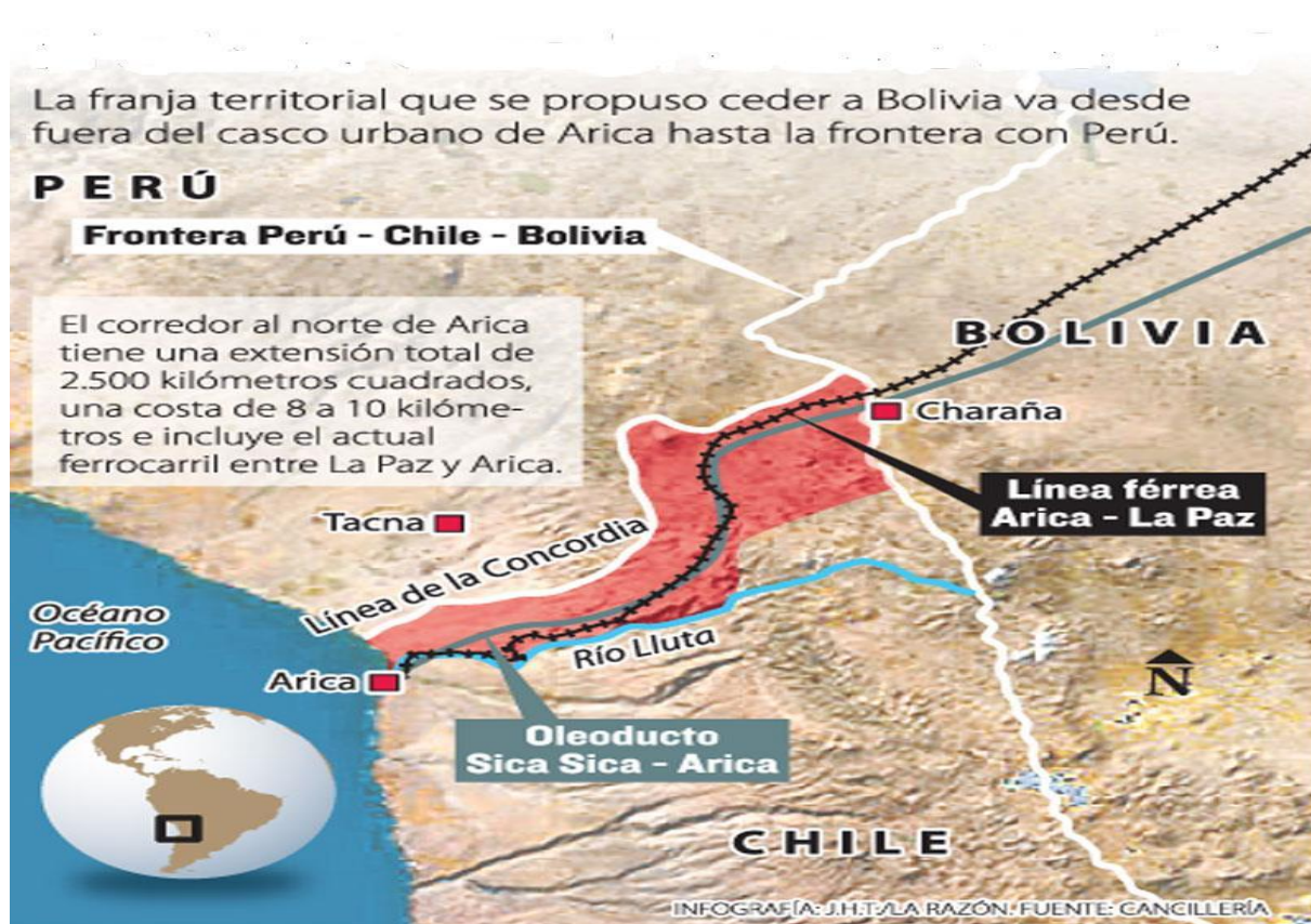
Mapa 2: Corredor Boliviano sin soberanía.