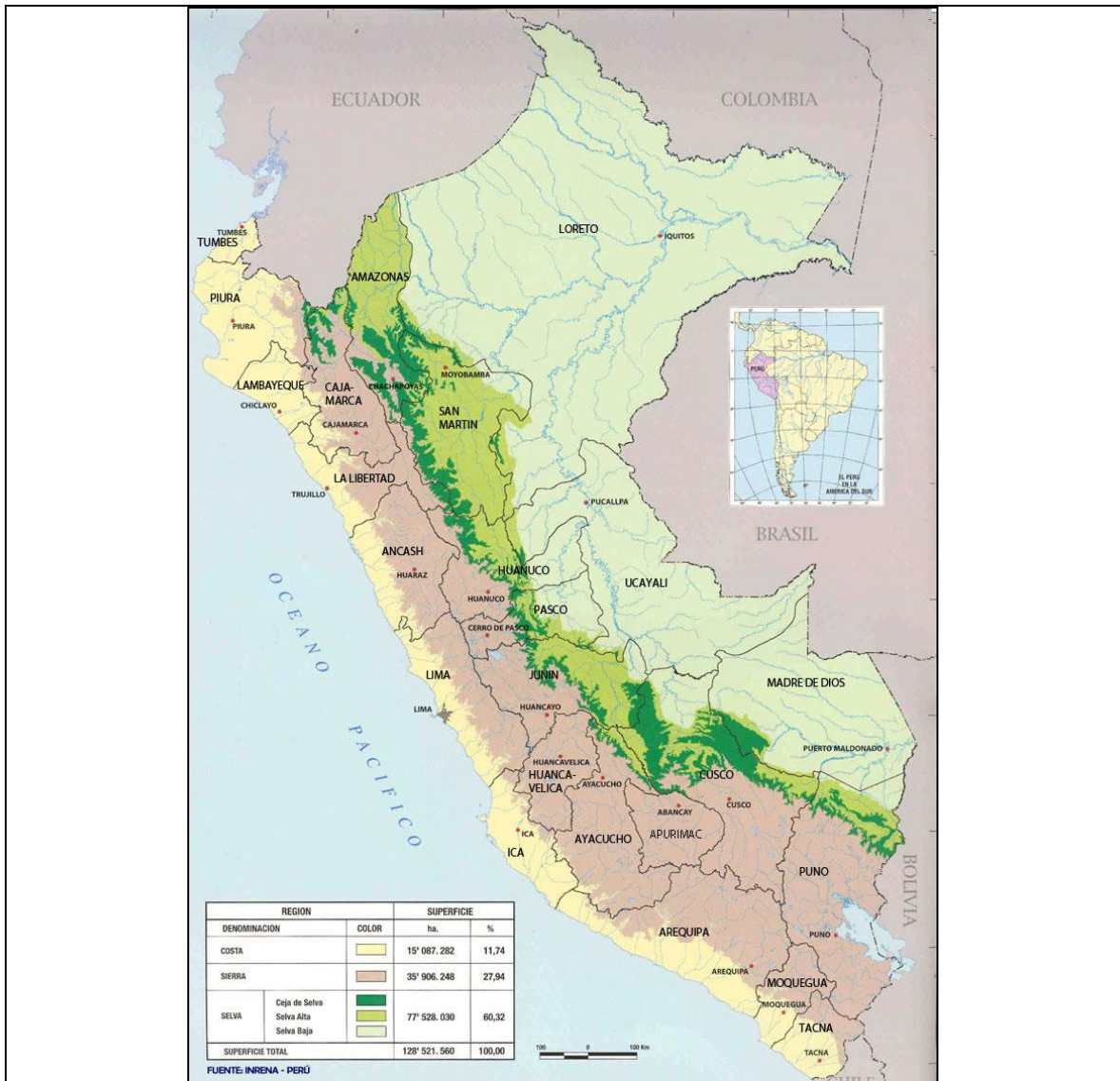
Gráfico 1. Mapa del Perú. División por grandes regiones: Costa, Sierra y Selva.

Departamentos de la Costa: Tumbes, Piura, Lambayeque, La Libertad, Ancash, Lima, Ica, Arequipa, Moquegua y Tacna.