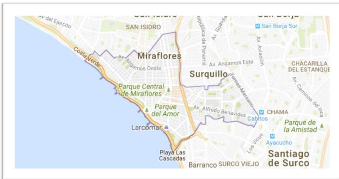
Ilustración 1. Ubicación del distrito de Miraflores

Miraflores es uno de los cuarenta y tres distritos que conforman Lima Metropolitana, ciudad capital de Perú, en Sudamérica. Es un distrito costero que se encuentra a 79 metros sobre el nivel de mar; cuenta con una superficie de 10 kilómetros cuadrados, de las cuales aproximadamente 1 kilómetro es de áreas verdes distribuidas en 74 parques. El distrito de Miraflores, se encuentra ubicado en la parte sur oeste de Lima, limita con los siguientes distritos: Por el norte con Surquillo y San Isidro, por el este con Surquillo y Surco, por el Oeste con el Océano Pacífico.