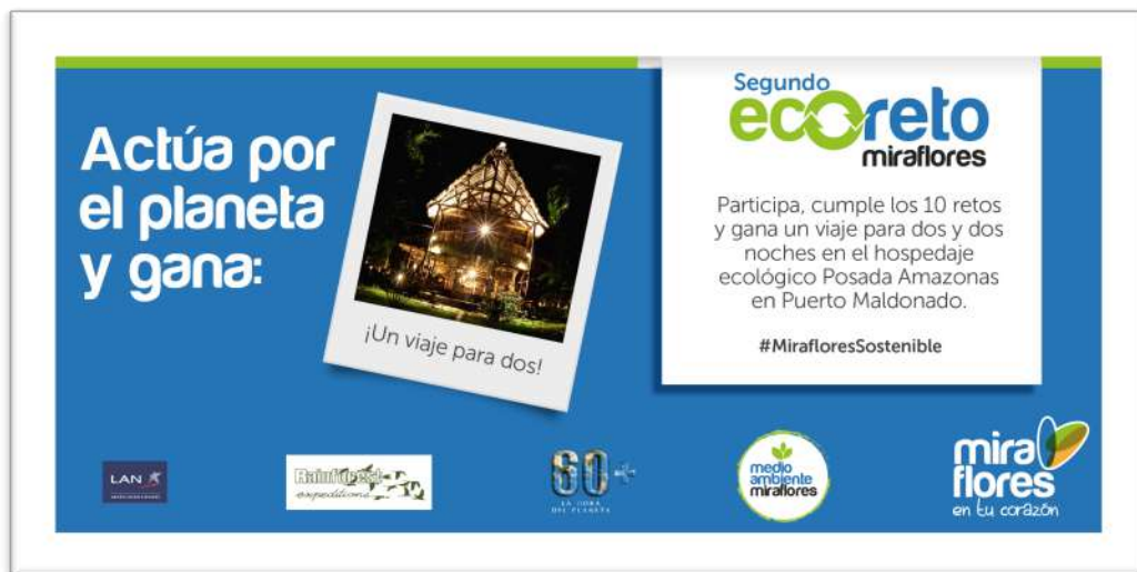
Ilustración 3. Banner publicitario del concurso (Municipalidad de Miraflores)

Luego de cumplidas todas las acciones del “Eco Reto Miraflores”, los equipos envían la evidencias de cumplimiento al Facebook del área ambiental de la Municipalidad, donde se verifica quiénes cumplieron con las acciones ambientales. Entre los equipos que cumplen con todos los retos, se sortea pasajes y estadías en lugares ecoturísticos.