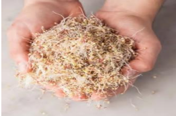
Figura 13: brotes de quinua.

El momento óptimo para la utilización de las hojas de quinua en la alimentación humana es un poco antes del inicio de la floración, aproximadamente entre los 60 y 80 días después de la germinación 5 . El contenido de proteína y lípidos de los brotes y hojas de quinua es entonces muy elevado, incluso superior al de algunas hortalizas de consumo diario como la alcachofa, la cebolla, los berros y la espinaca.