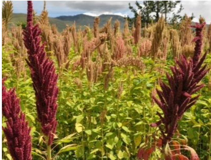
Figura 4: Planta de amaranto.