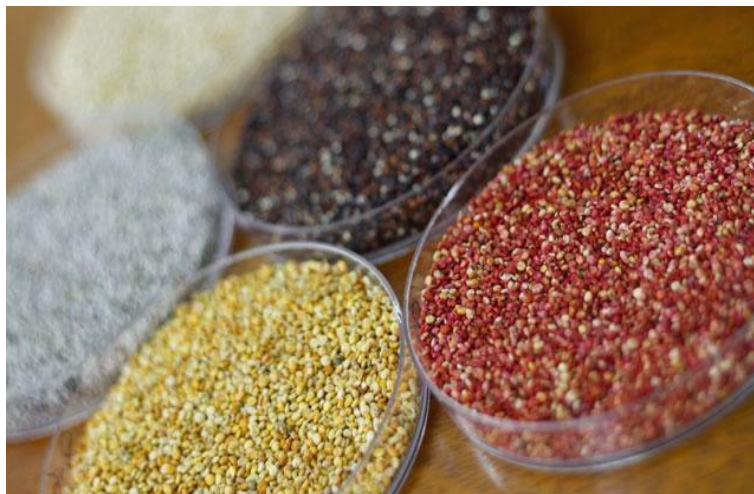
Figura 10: tipos de quinua

Dadas las características químicas del grano de quinua (alto contenido de saponina), su consumo ha estado sujeto a la práctica de diversas formas de eliminación de la saponina más o menos rudimentarias. La consolidación del interés de los mercados internacionales por la quinua, y la ampliación de los volúmenes de producción de este pseudocereal, han llevado al desarrollo e implantación de métodos mecánicos para la eliminación de la saponina y otras impurezas. En el apartado 3. 1. 2. se ha descrito los más importantes. Al mismo tiempo, esto ha promovido la aparición de nuevos usos y aplicaciones medicinales, farmacéuticas y cosméticas, entre otras, para esta planta. Dado su alto valor nutricional, el principal uso de la quinua es el consumo humano 10 , y se usa principalmente el grano en sus diversas modalidades, tales como quinua perlada, harina de quinua, hojuela de quinua y quinua expandida.