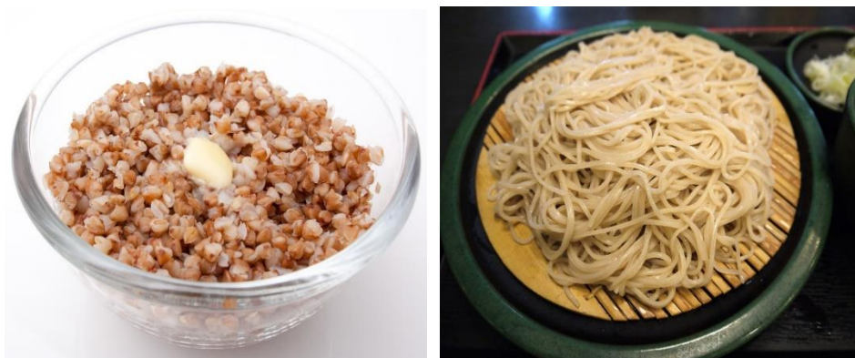
Figura 17: porridge de alforfón (izquierda) y soba (derecha).

El trigo sarraceno se consume de muy diferentes formas, según la tradición de cada país. En Europa y el norte de Estados Unidos la harina de alforfón se mezcla generalmente con harina de trigo para preparar bizcochos, galletas, fideos y cereales. En Rusia y Polonia, se utiliza sémola y harina de alforfón para hacer “porridge”, una mezcla o sopa semejante a la mezcla de avena con agua o leche, de origen inglés, que se denominó así en el Reino Unido. En Japón, se consume principalmente como fideos o “soba”. “Soba” es en realidad la palabra japonesa para denominar al trigo sarraceno, pero se utiliza comúnmente para referirse a los fideos finos empleados en la cocina de este país que se elaboran con la harina de dicho grano. En el sudeste de Asia, el trigo sarraceno es un alimento básico en muchas áreas montañosas. En Canadá, la harina de trigo sarraceno se usa para hacer un pan sin levadura llamado “ chapattis ”. También se usa el alforfón para hacer bebidas alcohólicas, y al licor preparado se le atribuyen propiedades medicinales.