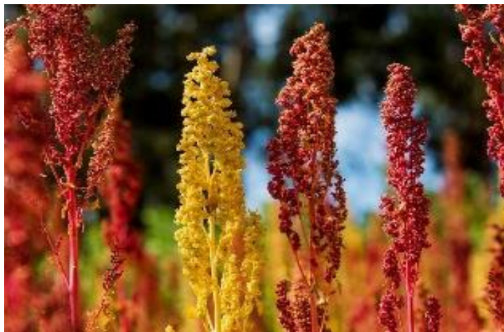
Figura 1: Planta de quinua.

La quinua ( Chenopodium quinua , Willdenow) es una planta dicotiledónea, que pertenece a la familia Chenopodiaceae. Su altura es variable según la variedad de que se trate, y puede medir entre 0,6 y 2 metros. Posee una raíz ramificada de unos 20 a 25 centímetros, y generalmente son plantas hermafroditas que se autopolinizan 3 . Las semillas tienen aproximadamente 2 milímetros de diámetro y están encerradas en el cáliz de la flor. Esta planta presenta una gran variabilidad y diversidad genética. Sus variedades o ecotipos se pueden clasificar, según su adaptación a las características geográficas, en las 5 categorías básicas siguientes: quinua del valle, quinua del altiplano, quinua de terrenos salinos, quinua del nivel del mar y quinua subtropical 5 .