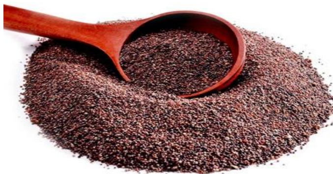
Figura 7: Grano de kañiwa

La kañiwa es una planta originaria de los Andes del Sur de Perú y Bolivia. Este cultivo está relacionado con la cultura Tiahuanaco, que tuvo su centro en el altiplano del lago Titicaca, área donde en la actualidad se cultiva con preferencia. El cultivo de la kañiwa no está difundido fuera de la zona del altiplano peruano-boliviano. El cultivo recibe mayor atención en Perú, donde la superficie cosechada llega a las 7.000 hectáreas por año. En Bolivia el área de producción de kañiwa es tan pequeña que la especie ni siquiera figura en los censos agropecuarios anuales. Se cultiva en pequeñas parcelas donde el área de cultivo apenas llega a las 2.000 hectáreas por año, y, de esta producción, el 85% aproximadamente está destinado al autoconsumo. El resto se destina a la agroindustria y a mercados de abasto.