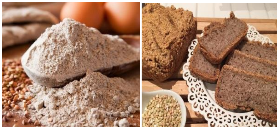
Figura 18: Harina de trigo sarraceno (izquierda) y pan elaborado con trigo sarraceno (derecha).

Dentro de los subproductos derivados del trigo sarraceno, destaca especialmente la harina. Esta es de fácil obtención a partir de la molienda, y proporciona un buen rendimiento tanto de harina refinada como de harina integral. Por su excelente valor nutricional y su carencia de gluten, el trigo sarraceno es en realidad un producto muy atractivo en la industria de la panificación, y resulta especialmente valioso como alternativa para aquellas personas con enfermedad celíaca. En algunos casos, el trigo sarraceno se añade a productos formulados en base al trigo común, lo que permite la obtención de alimentos fortificados, con una composición diferencial de vitaminas y minerales, y con mayor contenido en proteínas que contienen aminoácidos esenciales no presentes en los cereales.