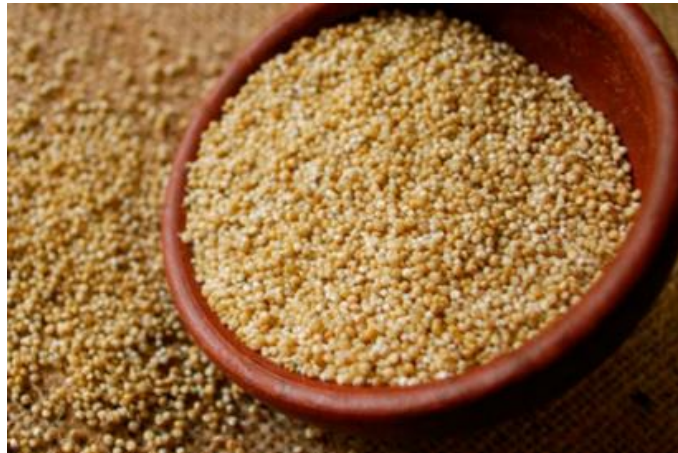
Figura 5: granos de amaranto

oficiales de exportaciones e importaciones. El amaranto tiene diferentes nombres, según su lugar de producción. En la región andina del Perú se conoce como “ Kiwicha ”; en Bolivia se le denomina “ Coimi ”; en la India recibe el nombre de “ Ramdana ”.