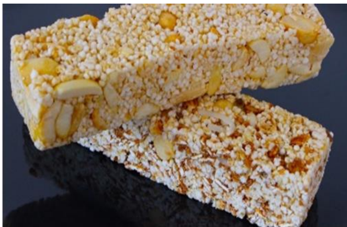
Figura 15: Barritas de amaranto ( Fuente: Blog caxa amaranto )

También se consumen en la actualidad los brotes y hojas de amaranto. El germinado es un proceso antiguo que ofrece una alternativa para incrementar la calidad nutritiva de los granos. Para que se produzca el proceso de germinación, es necesario colocar el grano en condiciones adecuadas de humedad (35-40%) y temperatura (25-30°C). El tiempo óptimo de germinación oscila entre las 48 y 72 horas, momento en el que la planta concentra la mayor cantidad de proteínas (entre un 16 y un 18,5%). La hoja del amaranto es también una fuente rica de carotenos y hierro, y contiene concentraciones de proteína comparables a las de otras verduras como las acelgas. Al igual que el grano, las hojas presentan un alto contenido en lisina y, por lo tanto, pueden utilizarse como suplemento para los cereales.