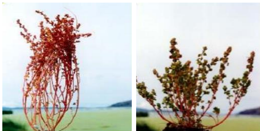
Figura 6: kañiwa tipo Saiwa (izquierda) y Lasta (derecha).

crecimiento erguido y con pocas ramificaciones; La forma “Saiwa” tiene sin embargo numerosas ramificaciones que empiezan en el cuello de la planta. El fruto de la kañiwa está cubierto por el perigonio (envoltura exterior, rica en fibra dietética), que es generalmente de color gris. La semilla es de forma lenticular y tiene un tamaño comprendido entre 1 y 1,2 milímetros de diámetro (más o menos la mitad del tamaño de los granos de la quinua). No contiene saponina. A pesar de su amplia variabilidad genética, la kañiwa solo cuenta con tres variedades plenamente caracterizadas, denominadas variedades “Cupi”, “Ramis” y “Cyclan” 4 . El valor nutricional de sus granos y su tolerancia a las heladas, hacen que la kañiwa se considere un cultivo estratégico y de seguridad alimentaria para sistemas de producción de alto riesgo, como el altiplano.