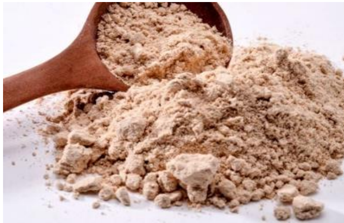
Figura 14: Harina de amaranto

En la actualidad, la harina de amaranto se utiliza de dos formas: en la elaboración directa de productos como sopas, bizcochos, cereales para desayuno, bollos, creps, tostadas, galletas, empanadas o pastas, y para enriquecer harinas de otros cereales que a su vez se utilizan para elaborar productos y alimentos para bebés.