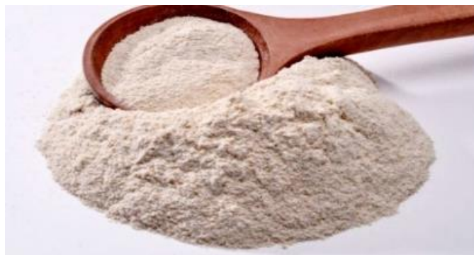
Figura 11: harina de quinua