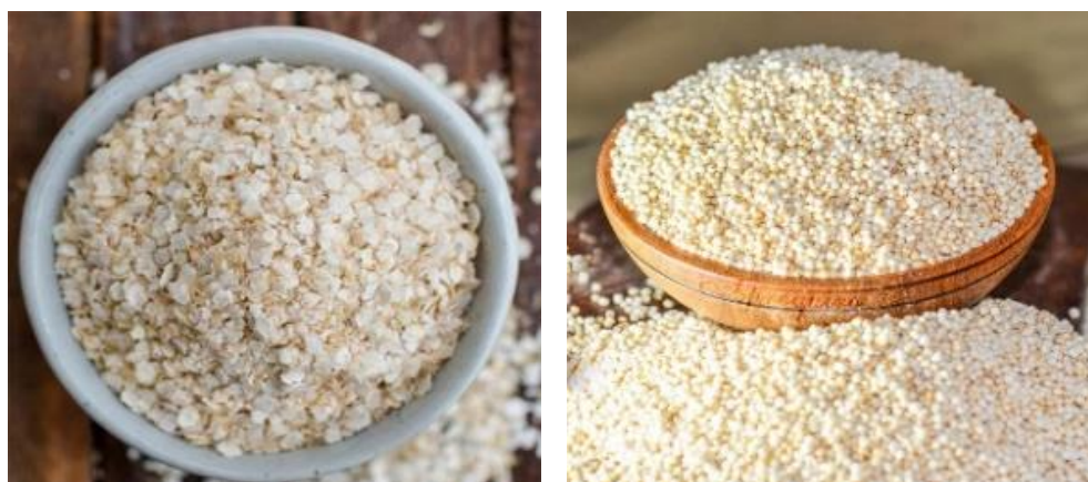
Figura 12 hojuelas de quinua (izquierda) y quinua expandida (derecha)

La quinua expandida, llamado “quinua pop”, o quinua extrusionada, se obtiene generalmente a partir de la quinua perlada, aunque algunas veces también se obtiene de la quinua al natural. Para su obtención, los granos de quinua se someten a altas temperaturas y a una descompresión violenta. Como resultado, se produce la expansión de los granos de quinua. La quinua expandida puede consumirse directamente, o acompañada de yogur, helados, postres o chocolate.