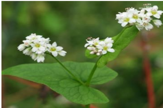
Figura 8: planta de trigo sarraceno

El trigo sarraceno ( Fagopyrum esculentum Moench ) es una planta de la familia Polygonaceae que alcanza entre 0,6 y 1,3 metros de altura. Las hojas de la planta crecen de forma alterna y tienen la característica de ser grandes y tener forma sagitada (forma de corazón). Presenta un tallo rojizo que termina en una inflorescencia en forma de pequeños racimos o agrupaciones de flores, que son pequeñas y de color blanco o rosa. El grano, que se utiliza principalmente para la alimentación humana, tiene forma triangular y estructura leñosa y su color varía de café a gris. Está recubierto por una cutícula que no es comestible y que obliga a que el grano sea descascarillado para su consumo.