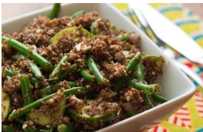
Figura 16: Guiso de kañiwa

La kañiwa también se consume en forma de hojuelas, tras someter a los granos a un proceso de laminado. Las hojuelas constituyen uno de los mejores productos para mantener los nutrientes de este pseudocereal en forma concentrada. También se elaboran “pop” de kañiwa, producto que mantiene el 80% de los nutrientes, y que se consume con leche, yogurt, zumos o ensaladas de frutas.